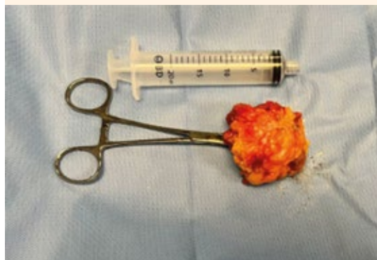
Figura 4. Pieza quirúrgica: masa de la fosa iliaca derecha.

plano graso del tumor de piel y tejidos blandos en la fosa iliaca derecha, a 5 cm de la línea media, encapsulado, con tejido inflamatorio yuxtalesional por encima de la aponeurosis de 8 x 3 x 2 cm ( Figura 4 ); se resecó de forma similar al previo. En el resto de la exploración no se encontraron lesiones visibles o palpables.