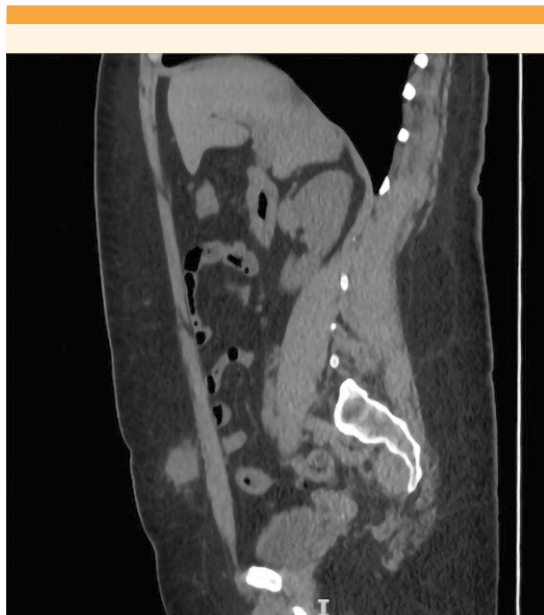
Figura 1. Corte sagital de la tomografía donde se observa una masa paraumbilical.