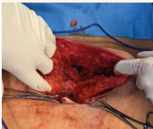
Figura 3. Endometrioma en tejido celular subcutáneo. Se visualiza la fascia aponeurótica íntegra.

disección roma de tejidos blandos ( Figura 3 ). En primera instancia se identificó un tumor paraumbilical derecho, cercano al defecto herniario de piel y tejidos blandos de 4 x 2 x 2 cm, indurado, con tejido inflamatorio graso perilesional que se resecó sin afectar el margen libre de 10 mm. Posteriormente, se procedió a la disección en