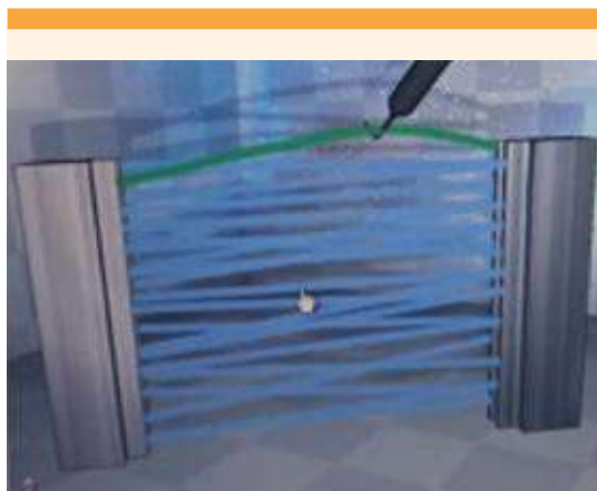
Figura 4. Ejercicio 8-electrocoagulación.