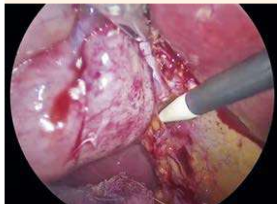
Figura 2. Vesícula biliar a tensión por hidrocolecisto.

embarazo debido a una hernia posinsional en la región del primer puerto (supraumbilical). Se practicó cesárea tipo Kerr, oclusión tubárica bilateral y plastia de pared. El sangrado transoperatorio fue de 500 mL, pero no requirió hemotransfusión. El desenlace neonatal fue óptimo, se obtuvo un recién nacido de 3260 g, Capurro de 37.5 semanas de gestación y Apgar de 8-9. Ambos fueron dados de alta del hospital en condiciones satisfactorias.