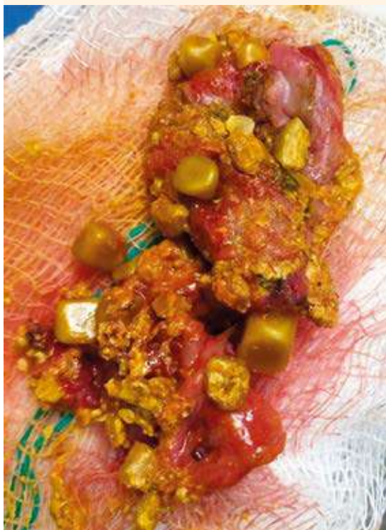
Figura 4. Pieza quirúrgica con la vesícula biliar con múltiples cálculos.