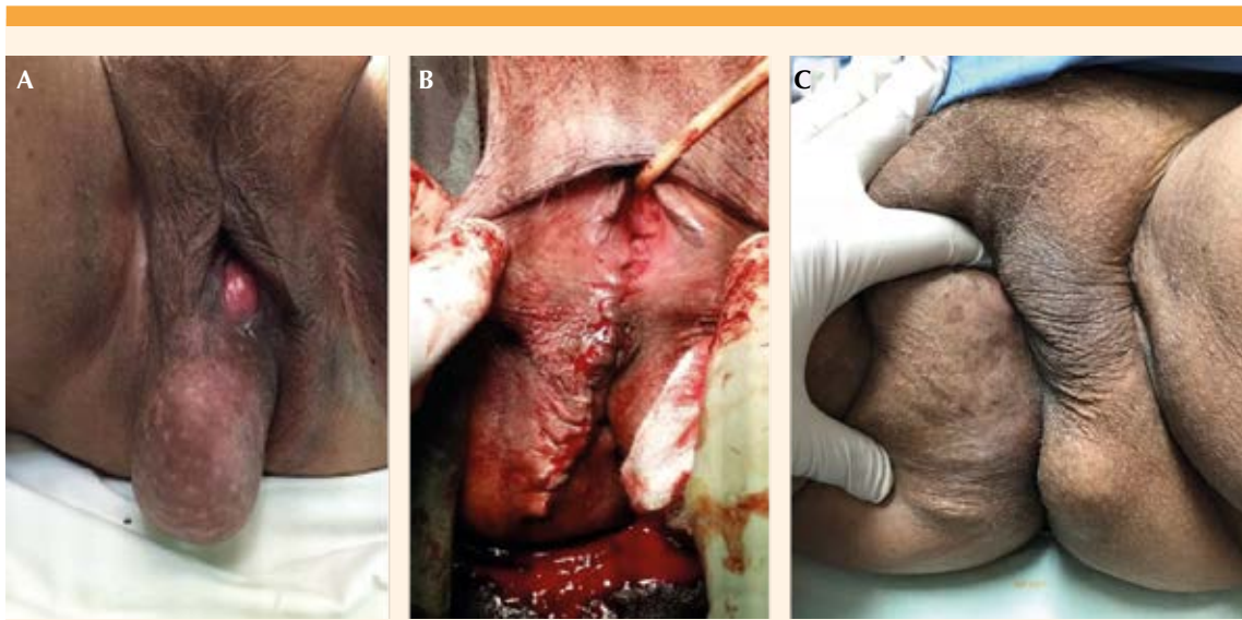
Figura 1. A) Protuberancia vulvar. B) Aspecto posoperatorio. C) Recidiva.

La inmunohistoquímica de la biopsia tomada en la primera intervención (2015) reportó el inmunofenotipo: actina de músculo liso positiva focal y negatividad para los marcadores MDM2, MYOD1 y S-100 ( Figura 2 ), compatibles con el diagnóstico de leiomioma.