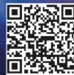
IPP EVOCS III ® Solución