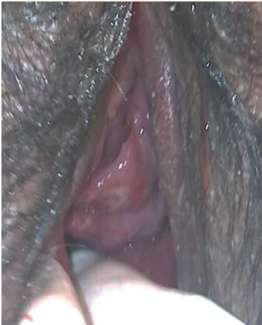
Figura 1. Laceración de la pared vaginal anterior con afectación de la pared uretral total.