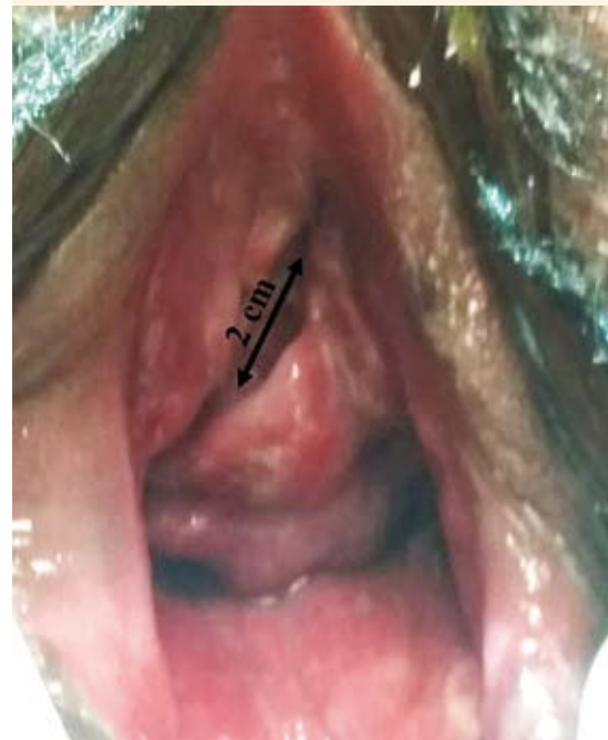
Figura 2. Revisión prequirúrgica. Flecha: longitud de laceración uretral.

La paciente se dio de alta dos días después de la cirugía, con un cateterismo vesical continuo mediante sonda Foley durante seis semanas. En ese lapso se hizo el cambio de la sonda cada séptimo día con toma de urocultivos. Puesto que todos se reportaron positivos, siempre se indicó el correspondiente tratamiento con antibiótico.