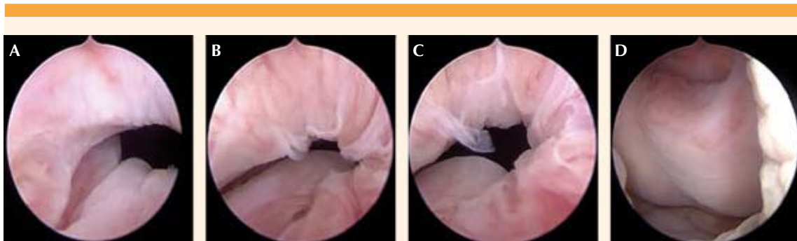
Figura 6. Cistoscopia postquirúrgica (1 año). A, B y C: zona de cicatrización entre las 7 y 8 horas del reloj, que corresponde al trayecto de la uretroplastia. D: borde inferior del meato uretral externo adecuadamente cicatrizado.

pacientes; muchas inician con incontinencia urinaria, fecal, prolapso de órganos pélvicos, dolor pélvico crónico o una agrupación de todos estos. El tratamiento quirúrgico está dirigido a mujeres en quienes la conducta conservadora no aporta buenos desenlaces o en quienes tienen un evidente defecto anatómico del complejo esfinteriano uretral, anal o del piso pélvico. 5,9 En la paciente del caso se encontró un desgarro uretral del 80%, al igual que del esfínter anal en todo su espesor (desgarro perineal III C).