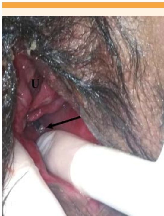
Figura 3. Revisión de la pared vaginal posterior.

de su última cirugía, con continencia urinaria y fecal, en ausencia de dolor pélvico, con vida sexual activa, regular y satisfactoria. El examen físico denotó adecuada cicatrización ( Figura 4 ), sin datos de prolapso de órganos pélvicos o exposición de cinta, el tabique rectovaginal y el cuerpo perineal con grosor normal ( Figura 5 ). La integridad del esfínter anal tenía fuerza y tono conservados y reconocimiento de los músculos del piso pélvico con fuerza perineal grado III en la escala de Oxford. La cistoscopia de control posoperatorio al año, se informó sin alteraciones y con cicatrización adecuada ( Figura 6 ). Se le indicó rehabilitación del piso pélvico.