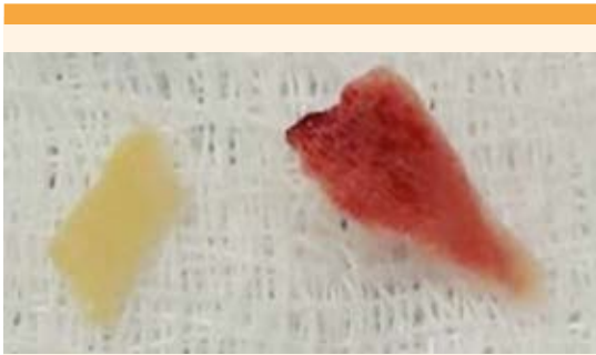
Figura 4. Hallazgos macroscópicos de metaplasia ósea de endometrio. Fragmentos de tejido, color blanco amarillento y de aspecto hemorrágico, ambos irregularmente aplanados, de consistencia dura y apariencia ósea.