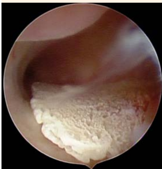
Figura 2. Cavidad uterina de tamaño normal, con endometrio atrófico ocupada por una lámina cribiforme de aspecto óseo de aproximadamente 2.5 x 1 x 0.3 cm.

La metaplasia ósea de endometrio es rara, casi siempre se diagnostica debido a un hallazgo fortuito, como en el caso expuesto. Los autores coinciden con Llata y colaboradores en que