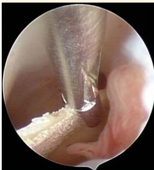
Figura 3. Grasper histeroscópico de 2 mm de diámetro, 34 cm de longitud que fragmenta la lámina cribiforme, de aspecto óseo. Se extrajo en su totalidad.