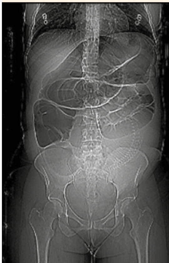
Figura 1. Radiografía de abdomen. Distensión marcada del colon y ausencia de aire en la ampolla rectal.

En los estudios de laboratorio se reportaron: 21,000 leucocitos por \text{mm}^3 , con 91% de neutrófilos y el resto de los valores dentro de parámetros normales. La ecografía abdominal mostró gran interposición gaseosa y líquido libre. La radiografía directa de abdomen evidenció una marcada distensión del marco colónico, con niveles hidroaéreos ( Figura 1 ). Ante la probabilidad de amenaza de parto pretérmino se le indicó útero-inhibición, maduración pulmonar fetal y