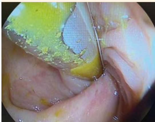
Figura 3. Colonoscopia flexible. Se observa la mucosa arremolinada del intestino.

b. Corte axial. Colon distendido con afinamiento de su calibre hacia distal (flecha).