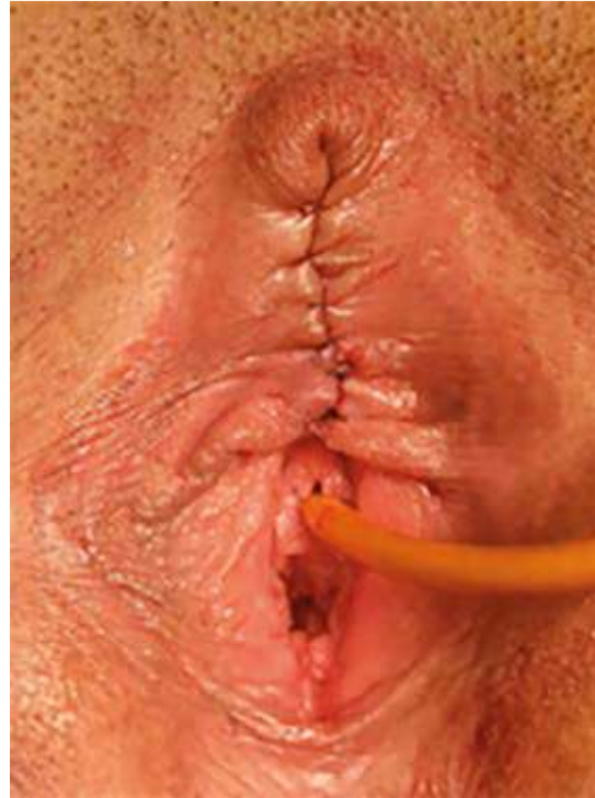
Figura 6. Posquirúrgico inmediato.

La clitoromegalia suele producirse por aumento de la liberación de andrógenos endógenos o exógenos. Las causas no hormonales de hiper-