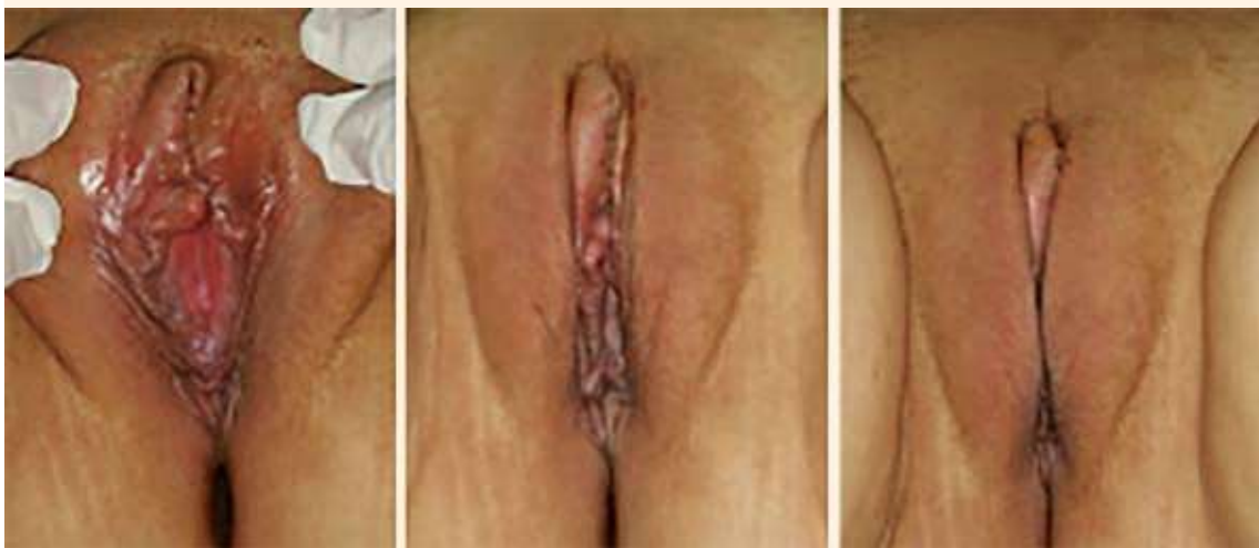
Figura 8. Imágenes captadas en la consulta, a una semana del procedimiento quirúrgico.

Existen dos publicaciones de 2017, la primera de una mujer de 62 años con una masa en el