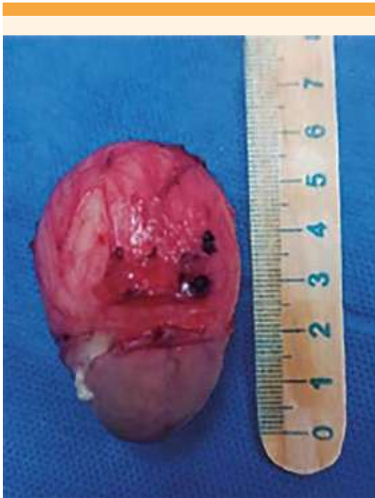
Figura 7. Tumoración resecada, de aproximadamente 5.5 x 4 cm.

de una paciente afroamericana de 17 años con quiste epidermoide en el clítoris, sin antecedente de mutilación genital. 5 En 2010, Osarumwense (citado por Osifo) 6 reportó 37 casos en Nigeria, con antecedente de mutilación genital y quiste de 3.5 a 6.5 cm, edad promedio de 17 años (14 a 21 años). En la Revista Chilena de Ginecología y Obstetricia se comunicó un caso de mujer africana, de 38 años, con un quiste de inclusión epidérmico como complicación tardía, antecedente de mutilación genital tipo II, o clitoridectomía total, durante la infancia. 7