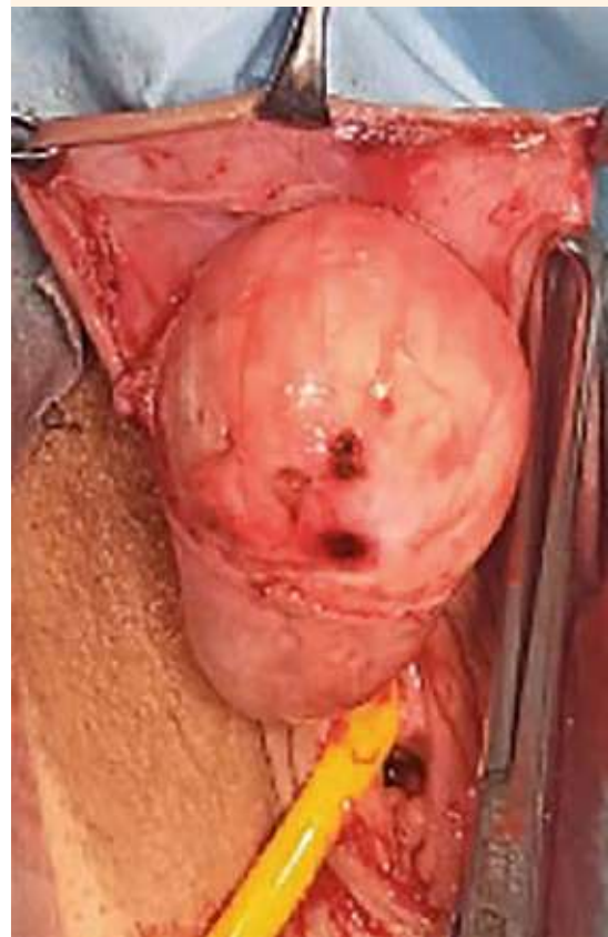
Figura 4. Disección de la tumoración quística.

con apariencia estética y preservación de la sensibilidad satisfactorias. No se observó afec-