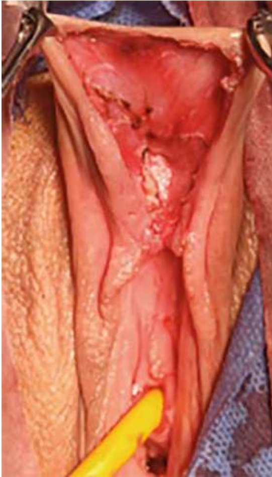
Figura 5. Disección completa de la tumoración.

tación de la anatomía del clítoris. El quiste fue enviado al Departamento de Patología, donde se estableció el diagnóstico de quiste epidermoide de inclusión. El seguimiento posquirúrgico transcurrió con adecuada evolución. Figuras 8 y 9