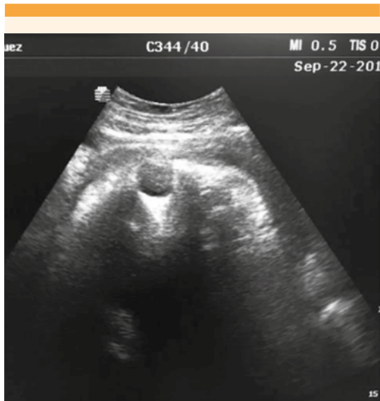
Figura 3. Signo de estrabismo izquierdo en occipito-transversa.

de forma rutinaria, los ángulos fetales cambian entre el primer y segundo periodo del trabajo de parto, pero sólo pueden considerarse factores predictores en el segundo. Finalmente, se discute establecer el diagnóstico de posición anómala, ya que el parto es posible en la mayoría de los casos, y no siempre debe recurrirse a la intervención quirúrgica; por tanto, el estudio de imagen solo debe realizarse en pacientes con trabajo de parto con evolución anormal. 12-14