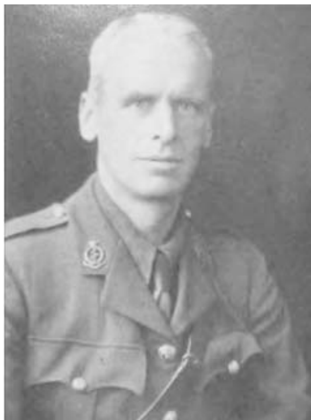
Figura 2. Fotografía de Ernest Starling en uniforme militar durante la primera guerra mundial, Circa, 1916. 4

La aportación insólita sobre el control de las hormonas sobre el equilibrio del funcionamiento multicelular tiene como antecedentes el concepto de la existencia de la "secreción interna" que se había propuesto cerca de medio siglo antes por Claude Bernard (1813-1878) y Charles Edouard Brown-Sequard (1817-1894); sin embargo estos insignes investigadores nunca mencionaron que existiera "un mensajero químico" y propusieron la exclusiva intervención del sistema nervioso autónomo. Otro de los antecedentes son los estudios sobre el reflejo condicionado de Iván Pavlov (1849-1936) quien había recibido el Premio Nobel en 1904 por su investigación por la acción refleja del nervio vago sobre la secreción pancreática. Bayliss y Starling