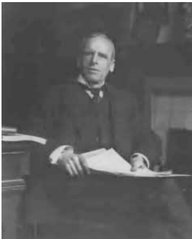
Figura 3. Ernest H. Starling, Profesor de Fisiología en University College en Londres, en su oficina en 1921. Esta fotografía ha sido reproducida en múltiples publicaciones.

nervioso y después se propuso que el control químico, en ese momento tímidamente llamado hormonal, podría poseer un radio mayor de influencia para alcanzar la modulación y la regulación de todo el organismo. Starling se atrevió a sugerir que este mismo mecanismo de regulación química podría operar en los componentes del reino vegetal. 2,3