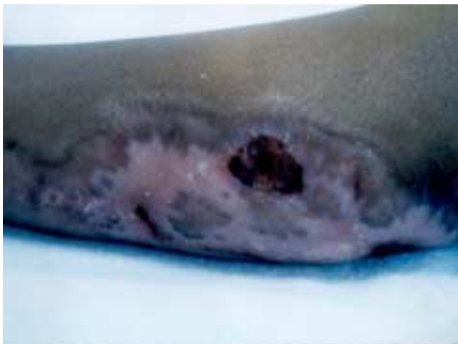
Figura 1. No obstante que la lesión estaba en vías de cicatrizar, se pueden apreciar islotes de tejido cruento que probablemente iban a requerir injertos de piel.

F emenino de 2 años de edad que tiene como antecedente el haber sufrido pérdida espontánea del estado de alerta unos días antes de ser llevada a sala de urgencias de nuestro hospital con dolor abdominal y vómito fecaloide. En la exploración física se le encontraron lesiones cutáneas diversas y quemadura de segundo y tercer grado en pierna derecha (Figura 1), así como signos evidentes de abdomen agudo, motivo por el cual fue llevada a sala de operaciones en donde la laparotomía reveló la presencia de sección casi completa de ileon (Figura 2). La evolución en la sala de terapia intensiva fue desfavorable ya que sufrió neumotórax derecho, sepsis, coagulación intravascular diseminada, hemorragia pulmonar sobreviniendo la muerte seis días después de haber sido operada. El tío materno la golpeaba consuetudinariamente.