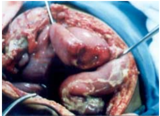
Figura 2. Un acercamiento del campo operatorio muestra cómo el impacto atrapó este segmento de ileon contra la columna lumbosacra causándole la sección en casi toda su circunferencia. Los signos de peritonitis son evidentes.