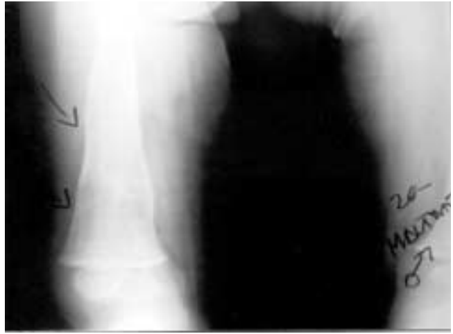
Figura 4. Fractura de fémur al menos tres semanas después de haber sucedido. Puede observarse que la remodelación ósea casi ha finalizado.

mediante programas de prevención terciarios 1 se puede modificar esta manera de perpetuarse; no respeta ideología ni color de piel, y carece de distribución geográfica específica. Se observa en todas las culturas, en pobres y en ricos y sin ser una condición sistémica, no se conoce área del cuerpo humano que no haya sido afectada. 2