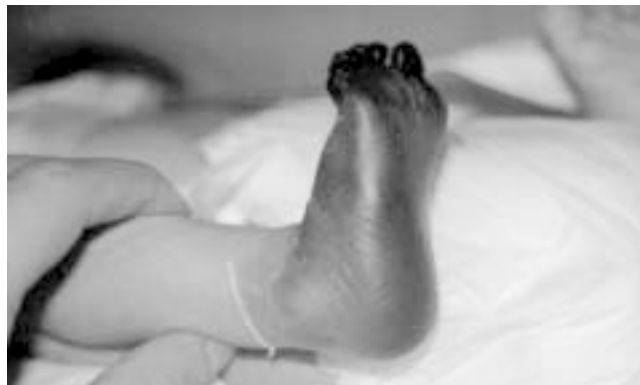
Figura 2. Lesión necrótica en pie derecho sobre la línea maleolar.

A su ingreso se encontró con palidez generalizada, taquicárdico y con presencia de lesión necrótica en pie derecho sobre la línea maleolar e hipotermia del área de lesión (Figura 2). Por la evolución y hallazgos clínicos y de laboratorio se consideró un proceso séptico agregado, con trombosis de pie derecho, probablemente secundaria a CID. Se inició manejo con doble esquema de antimicrobiano (Cefotaxima y Vancomicina), además de heparina a razón de 30 u/kg/día.