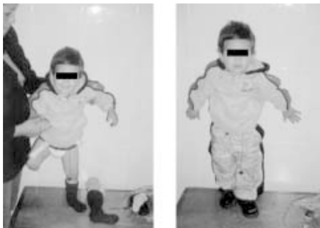
Figura 3. Colocación de prótesis. a) Muñón; b) utilización de prótesis.

Acudió a su primera cita postquirúrgica a los 21 días de su egreso, encontrándose en buenas condiciones generales, con muñón de buena coloración, sin datos de trombosis a otro nivel, con un TP de 19/13 seg. Se decidió suspender la heparina de bajo peso molecular, e iniciar tratamiento con acenocumarina a 0.25 mg/kg. Así mismo fue valorado por medicina física iniciando terapia de rehabilitación. Ocho meses después se colocó prótesis (Figura 3a y 3b). En la actualidad continúa su tratamiento con acenocumarina, además con apoyo de rehabilitación, con lo que ha tenido evolución favorable. En su última evaluación presentó, un TP de 12 /11 seg por lo que se incrementó dosis de acenocumarina a 0.50 mg/kg y se inició fisioterapia para utilización de prótesis (Figura 3a y 3b).