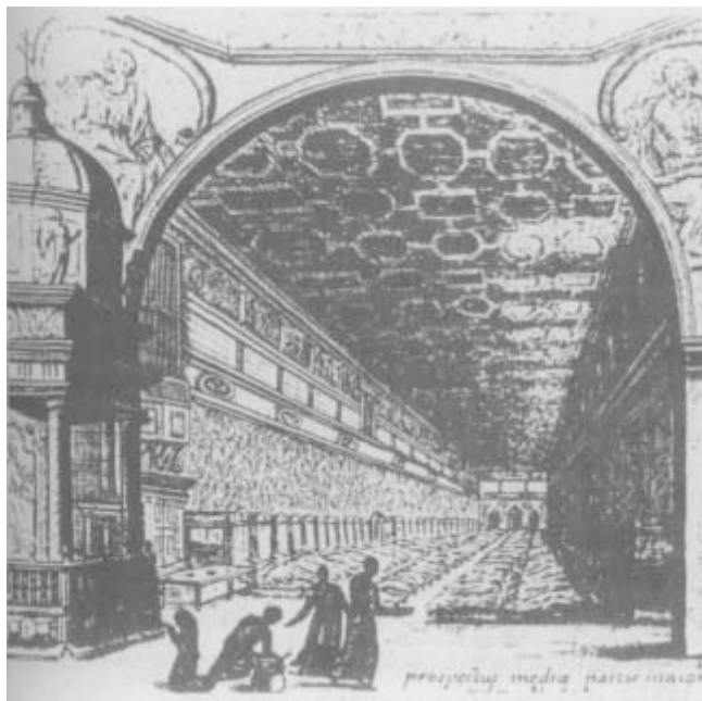
Figura 1. Una cuadra del hospital romano de Santo Spirito , en el siglo XVII. En Castiglioni A. A History of Medicine. (Tr. E. B. Krumbhaar). New York, Alfred A. Knopf 1946.

dicho hospital romano cada enfermo tenía su propia cama. Pronto éste se convirtió en el más importante de toda la cristiandad o sea en Arcispedale (Archihospital) llegando a tener numerosas filiaciones en Europa y después en América, particularmente en México y Perú. Aquí pueden verse todavía, sobre las portadas de las iglesias de tales hospitales, las insignias de su filiación: una doble cruz y un símbolo del Espíritu Santo (Figura 2).