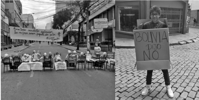
IMAGEN 2 “F21” cierres de calles en La Paz por el segundo aniversario del referéndum

Fuente: fotos tomadas por Kennemore, 21 de febrero de 2018.