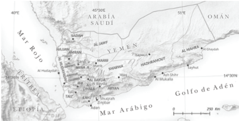
FIGURA 2 Principales ciudades y regiones de Yemen