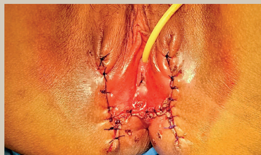
Figura 3. Se realizó cierre en un plano con sutura absorbible, liberando tensión con la disección de los bordes a afrontar.