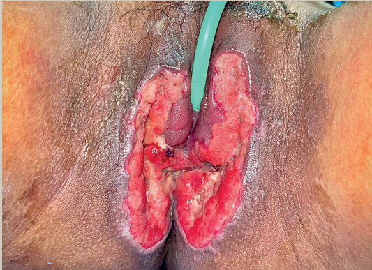
Figura 4. Evolución 2 semanas después de lavado quirúrgico y debridación. Se colocaron parches de hidrogel para inducir la granulación del tejido.