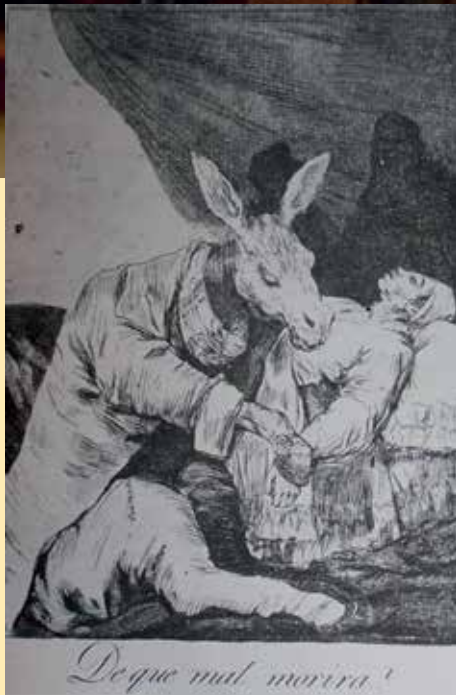
Figura 3. Grabado de Francisco de Goya (1746-1828)

La imagen fue uno de los grabados de la colección. Técnica: aguafuerte con aguatinta de la serie Los Caprichos . Madrid, 1797. Descripción: Caricatura del médico de Goya y una velada sátira del estado en que se encontraba España en la época de Manuel Godoy. Ars Medica . México: UNAM; 1981.