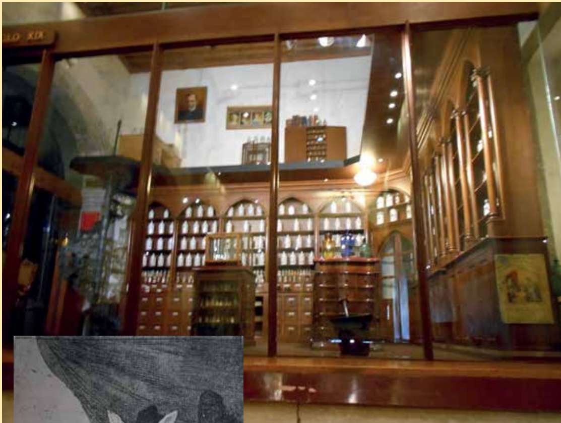
Figura 2. Botica. Siglo XIX.