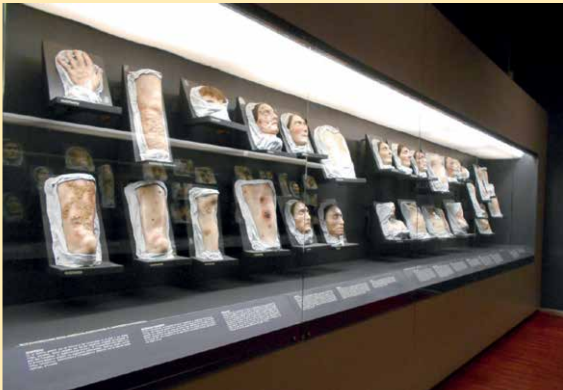
Figura 1. Colección de las piezas de cera.