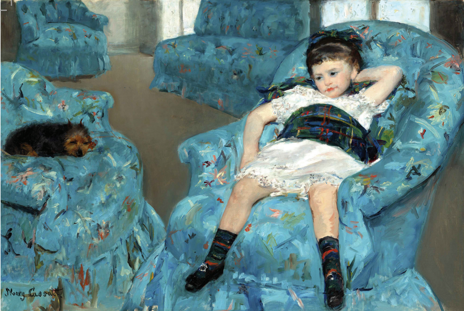
Niña en un sillón azul

He intentado emocionar a la gente con mi arte, en mis cuadros he intentado mostrar el amor y la vida. No hay nada que pueda compararse a la alegría de un artista al pintar.