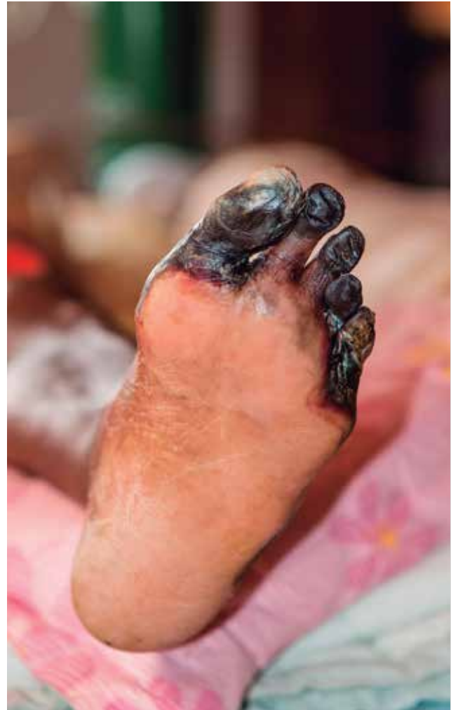
Figura 2. Pie diabético. Las zonas oscuras representan tejido necrótico. El paciente tenía ambos pies con lesiones extensas.

Los cambios que se presentan a causa de un incremento de glucosa plasmática crónica en un paciente, llevan a complicaciones como la ceguera, alteraciones cardiovasculares y renales; pero, es sin duda el pie diabético el que más costos económicos implica. Se estima que más del 70% de pacientes con complicaciones por diabetes sufren algún tipo de amputación de las extremidades inferiores. En Estados Unidos de Norteamérica se habla de más de 50,000 amputaciones anuales por causa de la diabetes 19 .