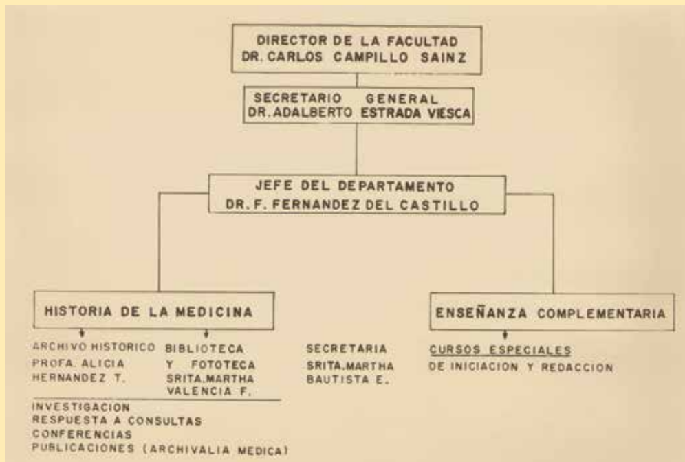
Figura 2. Organigrama del Departamento de Historia y Filosofía de la Medicina (1966-1971).

al centro histórico, al edificio que ocupó la Escuela Nacional de Medicina 4 .