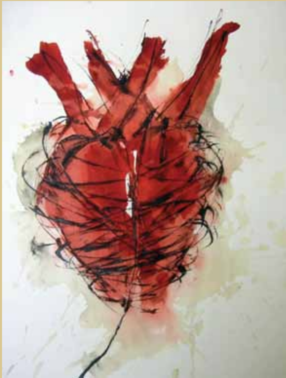
A su vez, Mar Domínguez Ruiz envuelve su corazón con algo que pueden ser alambres y lo titula Mi corazón .