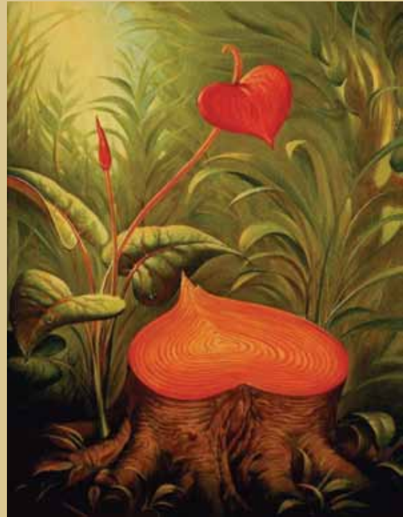
Erich Fried pinta un tronco de árbol y titula su obra Así tiembla mi corazón cuando escucha tu voz .

El Grupo Experimental Corazón juega con las formas y los colores de manera alegre, en tanto que Rafael García utiliza toda su creatividad para bañar al corazón con pintura magenta.