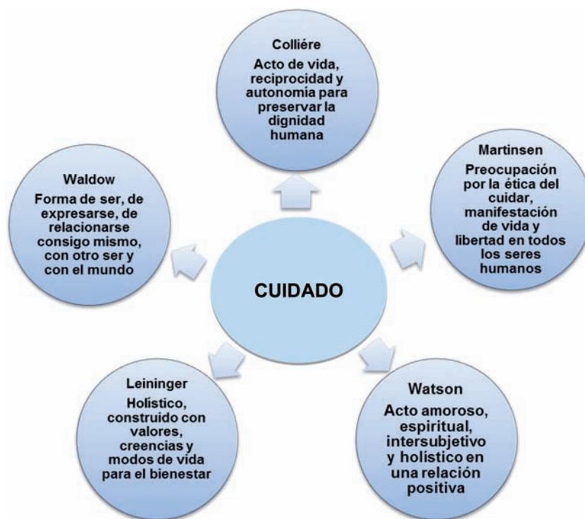
Figura 3 Noción del cuidado desde el pensamiento filosófico enfermero.

la enfermera asume esta responsabilidad como un valor que implica un conocimiento amplio, profundo y reflexivo sobre el cuidado.