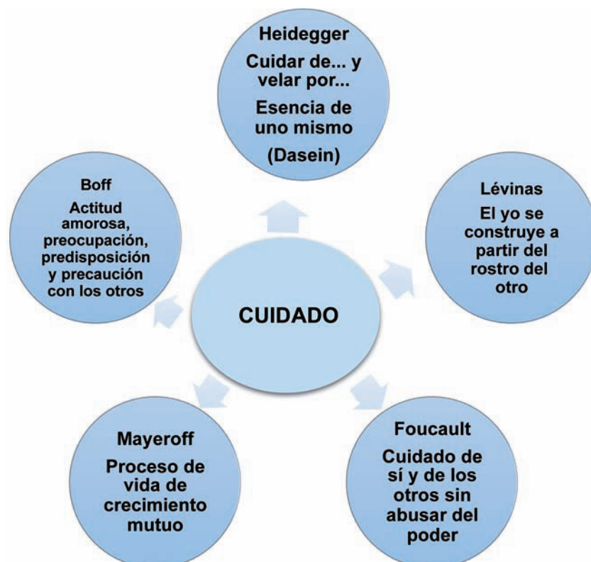
Figura 2 Noción del cuidado desde los filósofos contemporáneos.