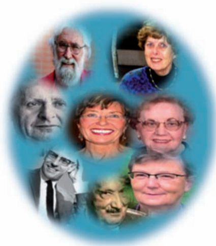
Figura 1 Filósofos del cuidado.

Al considerar que el cuidado es la expresión del trabajo amoroso, científico y técnico, que la enfermera realiza junto con la persona, con el propósito de desarrollar sus potencialidades, para construir formas de bienestar, mantener la vida, recuperar la salud o preparación para la muerte, que ocurre en los diferentes escenarios en donde se desarrolla o en donde procura su salud 3 ; concibe a la persona como la unidad esencial del cuerpo que le permite mediar entre la naturaleza, la cultura y el espíritu, como ser único indivisible y particular (espiritual, emocional, física, cultural, religiosa y social), que piensa, siente, quiere, desea, tiene alegrías, tristezas, objetivos y planes que le posibilitan su autorrealización, la libertad y la acción; consecuentemente se sugiere que la tarea del cuidar está infundida por la filosofía, ya que implica el análisis de los propósitos de la vida humana, de la naturaleza del ser y de la realidad, de los