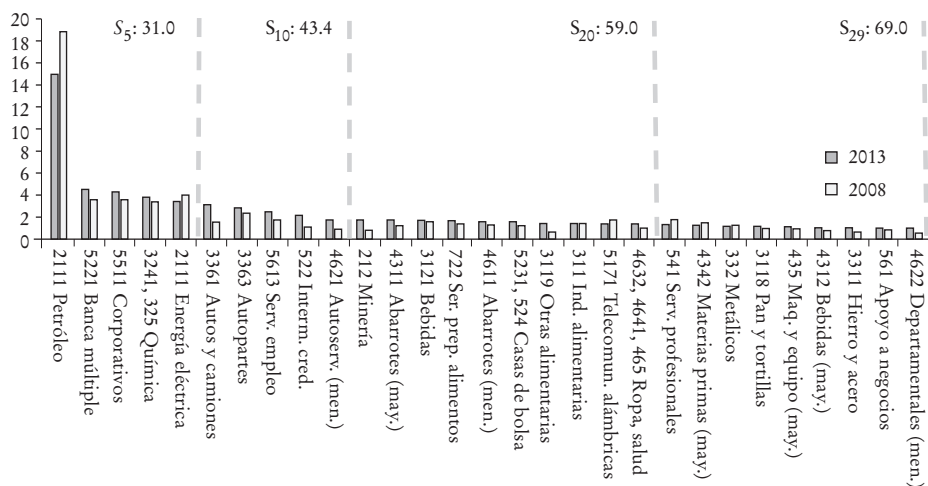
GRÁFICA 1. Actividades de mayor importancia en VA% nacional, 2013 y 2008