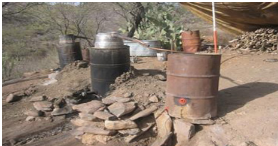
Figura 2. Proceso tradicional de elaboración de bacanora