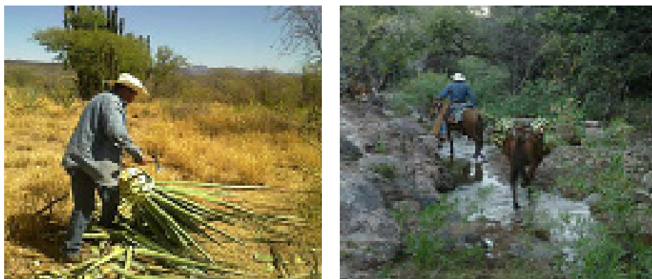
Figura 3. Selección, capado, jimado y recolección