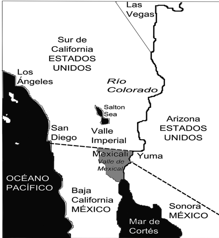
Figura 1 Cauce del Río Colorado del Lago Mead cercano a Las Vegas Nevada en Estados Unidos hasta el Mar de Cortés. Resaltado en color gris el territorio agrícola del Valle de Mexicali