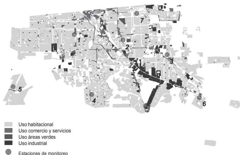
Figura 2. Usos de suelo en Mexicali