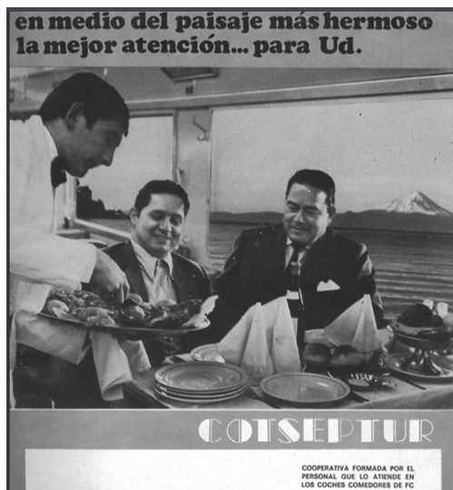
Figura 15. Publicidad del coche comedor con botella de vino invisibilizada. EV (1971-1972). https://drive.google.com/file/d/1LNWjgA7NyQUQ4ZB2IKkxGHTeKxa8JY5S/view?usp=sharing

La fotografía del coche comedor se completaba con las bellezas escénicas que se podían ver a través de la ventanilla. La conjunción del lago y el volcán nevado, servían para atraer la atención, y alejarla definitivamente, del vino criminalizado. La nueva dirección de la revista lograba así, cumplir el mandato impuesto por los sanitaristas, en el sentido de invisibilizar el vino. La etapa de valoración de la cultura del vino había quedado atrás.