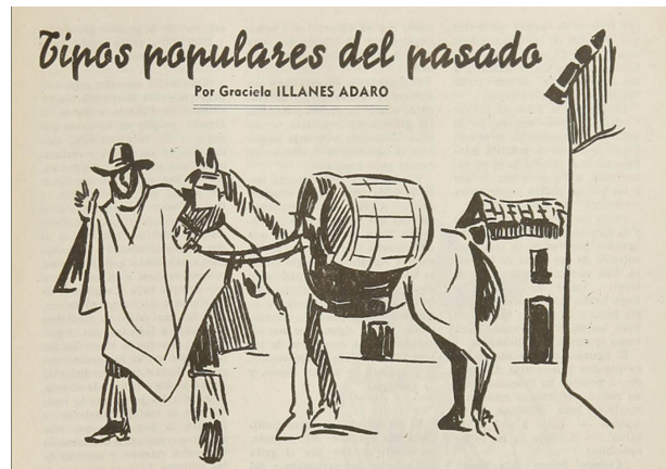
Figura 4. Arriero con mulas cargadas de vino. EV ene 1946.

esclavos afrochilenos. El papel de los arrieros como transportistas del vino a larga distancia mereció particular atención, lo mismo que los recipientes asociados al patrimonio vitivinícola como tinajas, pipas, chuicos y cachos (Figuras 4 y 5).