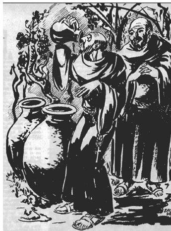
Figura 9. Frailes, tinajas y viña en cabeza. EV abr 1961.

Los artistas y dibujantes tenían a su alcance los dos modelos de viñas existentes entonces en Chile. Podían observar tanto las viñas geometrizadas de la industria, o las viñas espontáneas de los campesinos; y sin dudar, se decantaron por las viñas patrimoniales, cultivadas con los métodos tradicionales. La intuición los guió en esta elección, porque le encontraron mayor afinidad con el sentir popular. Lo mismo ocurría en ilustraciones dedicadas a representar la tradición de los religiosos en el mundo del vino (Figura 9).