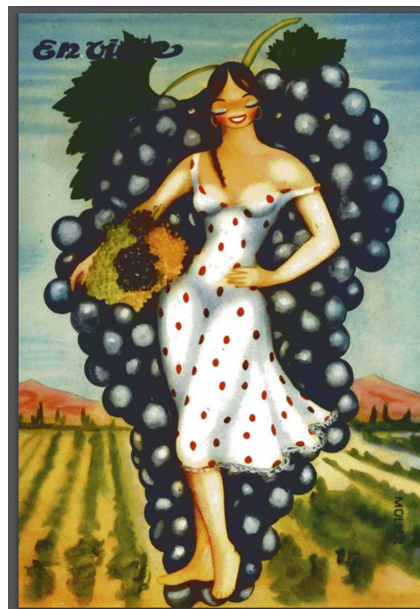
Figura 12. Vendimia en tapa. EV abr 1957. https://drive.google.com/file/d/1x1HNS6BucnRdAo57wnh_u38XbciQahun/view?usp=sharing