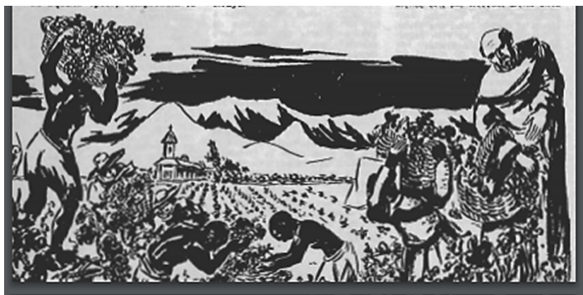
Figura 10. Vendimia colonial en viñedo cultivado en cabeza. EV abr 1961.

Las ilustraciones representan sujetos históricos diferentes, pero en viñas semejantes. Por un lado, las vendimiadoras danzan y bailan en la vendimia; por otro, los frailes disfrutan del vino en la intimidad monacal. En ambos casos, las viñas son cultivadas con los métodos tradicionales. Asimismo, la valoración del viñedo tradicional se reflejó en otra ilustración de esta revista, dedicada a representar una viña del periodo colonial, con todos sus elementos paisajísticos: frailes y esclavos afroamericanos cosechan la uva en un viñedo tradicional, cultivado en cabeza, con un convento y la cordillera como telón de fondo (Figura 10).