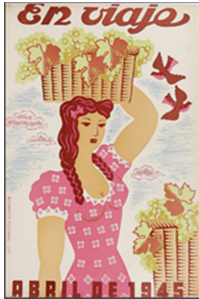
Figura 11. Vendimia en tapa. EV abr 1945. https://drive.google.com/file/d/16ojP3olSE35I7o04WXf3n3H35gXdtNqx/view?usp=sharing