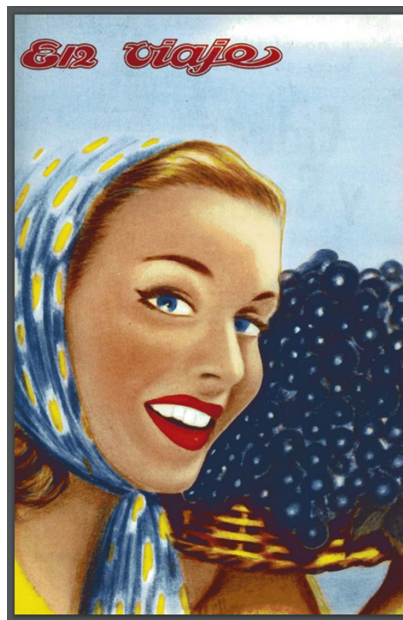
Figura 13. Vendimia en tapa. EV abr 1959.

https://drive.google.com/file/d/1XgCOx0cm67D7zWfunDWow6rs0kZ3QBz/view?usp=sharing