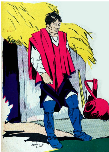
Figura 1. Campesino en su casa con una tradicional tinaja. En Viaje noviembre 1935. https://drive.google.com/file/d/1QzIcaIO6P8mm95s2bXIsSnLKqQUd1mBs/view?usp=sharing

Por lo tanto, en el proceso de visibilizar las bellezas escénicas de Chile, era inevitable incluir referencias al vino. Objetos de gran valor simbólico, como las tinajas, aparecían representadas en las ilustraciones de En Viaje , junto con espacios tradicionales de consumo y distribución del vino, como las pulperías (Figuras 1, 2 y 3).