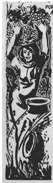
Figura 6. Vendimiadora con tinaja. EV abr 1961

https://drive.google.com/file/d/1hP13SE4W_7TpnQsAHCaIft8NYnqHz403/view?usp=sharing