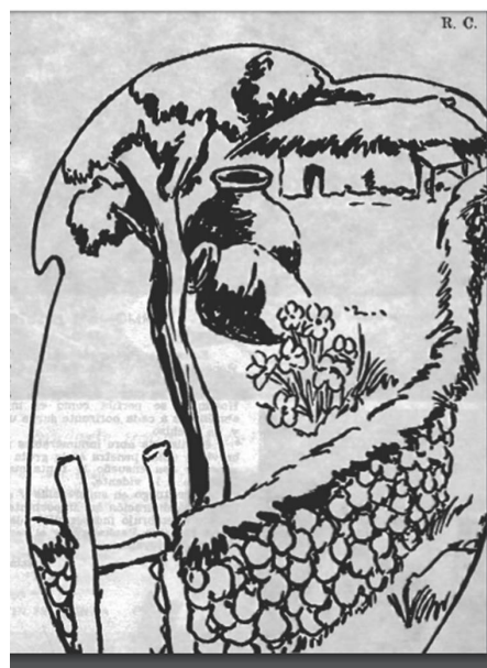
Figura 7. Bodega tradicional chilena con tinajas y pirca. EV set 1963.

https://drive.google.com/file/d/1hP13SE4W_7TpnQsAHCaIft8NYnqHz403/view?usp=sharing