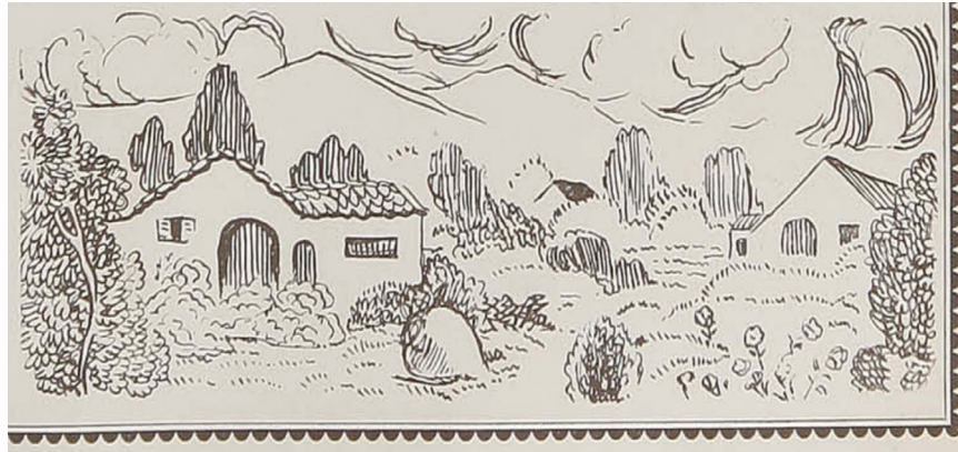
Figura 3. Paisaje tradicional chileno con tinaja en el centro. EV 88 feb 1941. https://drive.google.com/file/d/1yOkuqEHfjrXZwNqbTjlZ9b5rsIjxoQq4/view?usp=sharing

Sobre los símbolos en disputa, podemos reflexionar sobre el “poder simbólico” de Bourdieu (2000), para entender de qué modo la revista disputó elementos identitarios a los sectores dominantes del mundo tradicional rural, el cual se beneficiaba de los pequeños propietarios, para crear un imaginario de nación representativa de mayores sectores sociales en el ámbito nacional. El enfoque de En Viaje tendía a valorar el vino como patrimonio antes que el vino como producto industrial-comercial. Desde la perspectiva de la sociología de la imagen (Rivera Cusicanqui, 2010), que destaca el papel de los símbolos culturales, resulta interesante el trabajo de En Viaje , al representar símbolos de la cultura popular del vino como tinajas y pulperías. El interés era visibilizar la cultura del vino, sus tradicionales tinajas y viñas cultivadas en cabeza, propias de los campesinos, antes que las grandes fábricas de vino y las extensas plantaciones de espalderos en monocultivo, propias de la industria.