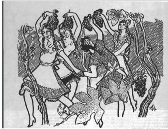
Figura 8. Vendimia en viña cultivada en cabeza. EV abr de 1961.

https://drive.google.com/file/d/1UIATMb67LuzCdL88fXHWcZVqSnmJCfOg/view?usp=sharing