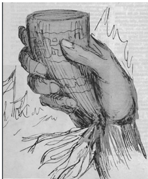
Figura 5. Brindis con cacho. EV may 1960.

https://drive.google.com/file/d/1VO1R9AYrgVUD5kPu_5Hi12vBNKYARe6H/view?usp=sharing