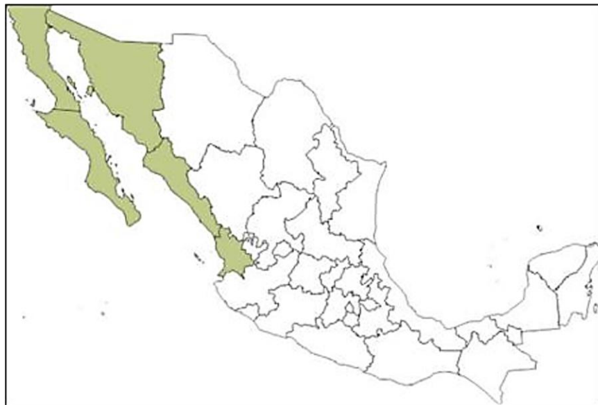
Figura 1. Región Noroeste de México.

En la Figura 1 se observa la región noroeste, la cual se compone por cinco de los treinta y dos estados de México: Sonora, Sinaloa, Nayarit, Baja California Norte y Baja California Sur (Conabio, 2010). Para el 2015, en esta región se localizaban 36 municipios urbanos, los cuales sumaban 9,396,047 habitantes, que significaban el 10.15 % de la población urbana nacional; mientras que, la población urbana nacional constituía el 74.2 % de la población total del país (Tabla 3, columnas 2 y 3).