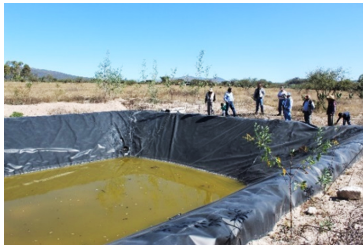
Imagen 7. Olla de captación de agua con los productores de nopal-verdura de San Francisco Tecajique, San Agustín Tlaxiaca.

El otro grupo localizado durante recorrido, productores de nopal-verdura del Ejido de San Francisco Tecajique, máxime espacio parcelado, seguido por uso común (Cuadro 6) (Mapa 1). Acorde a la información recabada en campo, menos de siete años cosechando nopal-verdura (atlixco y milpa alta), adultos de hasta 45 años. Cada uno de ellos cuantifica entre cuatro y seis hectáreas, frontera sin continuidad espacial en su haber, hasta el 20 % es utilizable. Existe presencia relativa de agricultura protegida y biopreparados artesanales, sin norma que valide. Araña roja, caracol y gusano barrenador, son las plagas más frecuentes. El peso mayoritario de asistencia técnica proviene del conocimiento adquirido en el tiempo, la parte restante de la política pública agraria (extensionistas). La producción se distribuye entre mercados locales (San Agustín Tlaxiaca y Pachuca) y autoconsumo. La falta de agua (a pesar de contar en promedio con tres ollas de captación sin operar) y capacidades tecnológicas para la transformación, principales limitaciones productivas afirman los productores (Imagen 7). Se cosechan, con tendencia a la baja, entre 15 a 30 cajas por hectárea, llega a venderse entre 40 y 80 pesos. 19