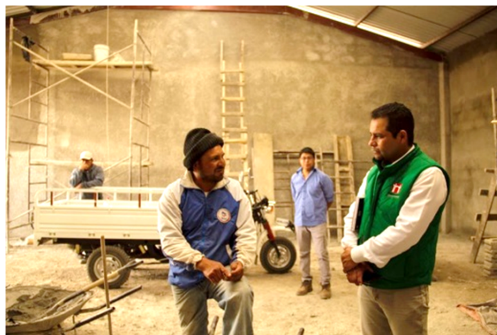
Imagen 9. Etapa inicial de la Procesadora y Centro de Acopio, Acelotla Zempoala.

En las constantes visitas al municipio, se reconoció el trabajo de los Productores de Nopal-Verdura de Acelotla (Mapa 1); el Núcleo Ejidal (NE) se encuentra en su mayoría parcelado, seguido por uso común y en pequeña proporción para asentamientos humanos (Cuadro 6). Cerca de dos años se impulsa la producción nopalera (variedad Copena 1) a partir del beneficio que recibieron del Programa Alto Impacto Productivo en Zonas Áridas y Semiáridas de México de la Comisión Nacional de Zonas Áridas (Conaza). La primera etapa del proyecto consistió en la construcción de cinco macro-túneles y la línea de conducción de agua (tanque); segunda fase, construcción del Centro de Acopio y Procesadora (CAyP), 20 % recursos propios, la restante inversión por parte de la política pública agraria (Imagen 9); tercera etapa se enfoca en transformar el nopal-verdura en harina comestible.