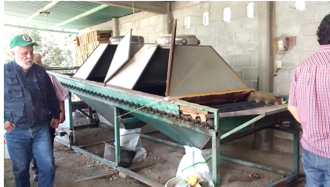
Imagen 3. Desespinadora nopal-fruta, Chicvasco, Actopan.

Fuente: imagen capturada por el autor, el 30 de junio 2016. Chicvasco, Actopan