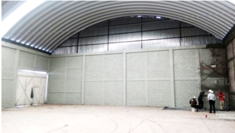
Imagen 10. Interior del Centro de Acopio Tunazem.