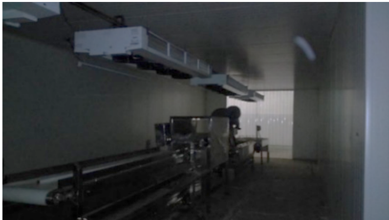
Imagen 2. Infraestructura industrial de grado alimenticio de la PCAER.

obedece al apoyo recibido de los productores por parte del gobierno federal (Secretaría de Agricultura, Ganadería, Desarrollo Rural, Pesca y Alimentación), componentes excedentes del petróleo. La procesadora contabiliza seiscientos metros cuadrados, aparte de oficinas, estacionamiento, patio de carga y área verde. En sus inicios fue controlada por la figura jurídica Triple S (Sociedad de Solidaridad Social), tiempo después atendida por 23 personas, perteneciente a diferentes comunidades alrededor de El Arenal, se transforma a Sociedad de Producción Rural de Responsabilidad Limitada (SPRL). 13 La frontera agrícola nopalera de los socios equivale en promedio a cincuenta hectáreas. A pesar de que la PCAER tiene vigencia de derechos fiscales ante el Servicio de Administración Tributaria (SAT), luz eléctrica, accesos privilegiados de carretera, infraestructura industrial de grado alimenticio (lavadora industrial, máquina de pre-secado, tina de saneamiento, banda de selección, mesa de desespina, máquina peladora, máquina de empaque-atmosfera modificada), peladora que no se ajusta al tamaño promedio del nopal, cuarto de enfriamiento, bascula de pesar, son limitados los alcances productivos, aún se sigue enfocando los esfuerzos en perfeccionar la línea del producto (Imagen 2).