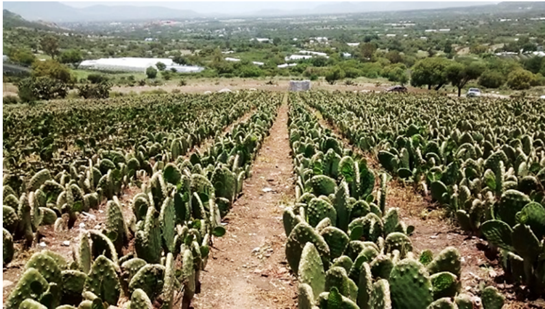
Imagen 1. Producción de Nopal en El Rincón, El Arenal.

Fuente: imagen capturada por el autor, el 30 de junio 2016. El Rincón, El Arenal.