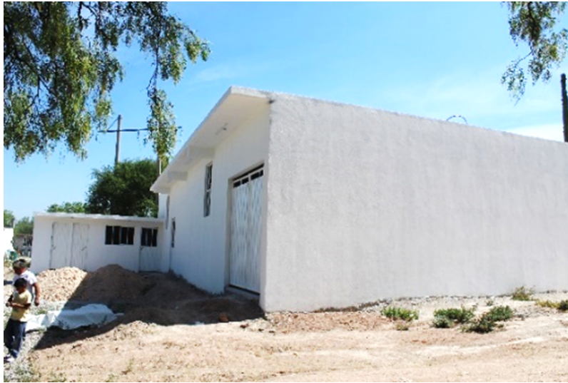
Imagen 11. Centro de Acopio de nopal-verdura, Lagunilla.