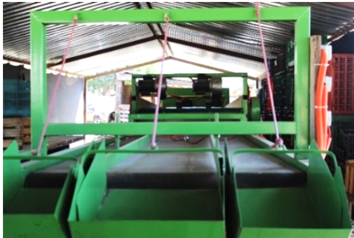
Imagen 8. Desespadora, Tepeyahualco, Zempoala.

utiliza la producción del nopal-fruta; 2.70 toneladas se obtienen en promedio sobre hectárea. Destaca que, a diferencia de los municipios antes descritos, 10 % del espacio agrícola existe el derecho de la tierra por rentar, aparecería o prestar (Cuadro 4 y 5). Aún la actividad agrícola es la principal fuente de ingresos en los hogares de Zempoala (71 %), seguido de pecuario (19 %) y de apoyos gubernamentales (11 %) (Sagarpa y FAO, 2014). La localidad de Tepayahualco quizás permiten explicar la funcionalidad de la producción tunera; el espacio agrícola en demasía se encuentra parcelado, seguido por parte mínima de uso común (Cuadro 6) (Mapa 2). Por la información primaria recabada, cerca de diez ejidatarios conforman la Sociedad Cooperativa de Tuna Tepeyahualco, veinte años trabajando como productores, hace tres empezaron a retomar la producción de tuna-alfajayucan y la tuna-roja; promedio de edad cercano a los sesenta años. La producción de tuna, la segunda fuente de ingresos por parte de los productores. Se caracterizan por experimentar el atraso de la producción de tuna máxime por el precio que puede alcanzar. En tiempo de temporada contratan entre diez y quince jornaleros, se cuenta con desespadoras de grado industrial ubicadas al interior de algunos hogares; inversión de la política pública agraria y productores (Imagen 8).