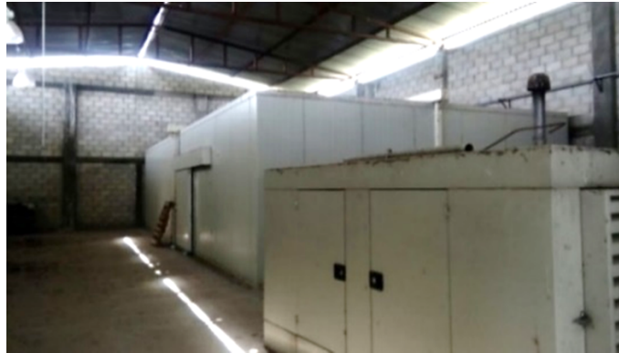
Imagen 4. Cámara de refrigeración del CAT-BB.

viabilidad tecnológica del centro por parte de los socios de la Integradora mucho menos por parte de la política pública agrícola de la entidad hidalguense.