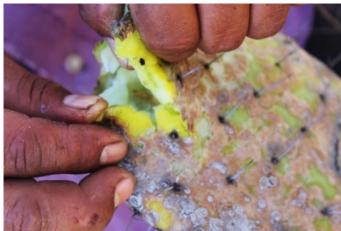
Imagen 5. Enfermedad nopal-fruta en San Juan Solís, San Agustín Tlaxiaca.

generalidad de las huertas sobrepasa los diez años, son de talla grande, se acercan al límite de altura y cobertura, requiere poda de rejuvenecimiento ( \approx 2 m de altura y 3 m de diámetro) antes de que se empiece a dificultar la cosecha y el tránsito entre las hileras de la huerta. Este tipo de poda es el más costoso por el volumen de material vegetativo que hay que remover, el retraso y la reducción de la producción atribuible a la recuperación de la estructura productiva de la planta (Mondragón y Ávila, 2013).