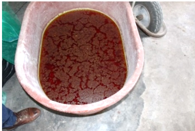
Imagen 6. Exiliado de lombriz de Tornacuxtla, San Agustín Tlaxiaca.