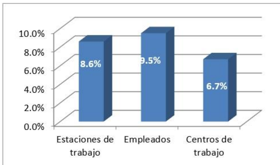
Gráfica 2: Importancia nacional de los call centers de la ZMG a nivel nacional (porcentajes)