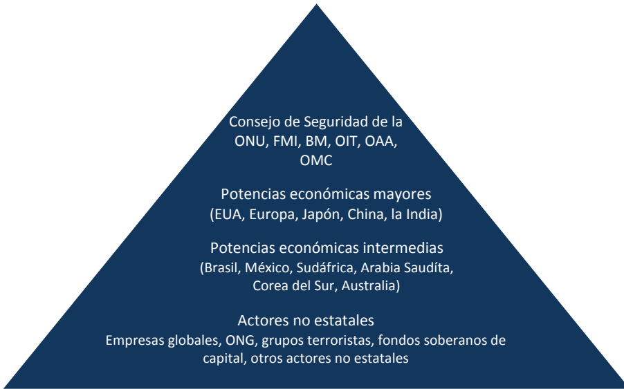
Figura 2 La pirámide de la gobernanza mundial al término de la década cero