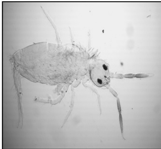
Figura 2. Colémbolo Seria sp., colectado en hojarasca y suelo en sistemas de manejo de mango Manila en la región centro de Veracruz, México.

1 Sistemas de manejo: S1-Tecnificado; S2-Transición; S3-Mínimo; S4- Tecnificado con caña de azúcar.