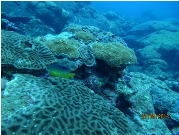
Figura 3. Panorámica de las áreas profundas del arrecife Blake, Veracruz.