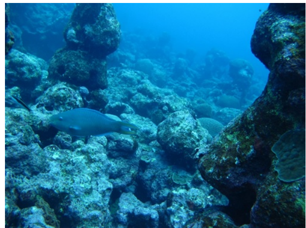
Figura 2. Panorámica de las áreas someras del arrecife Blake, Veracruz.

Figure 1. Geographic location of Blake reef, Veracruz, Mexico.