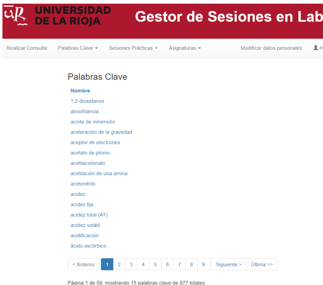
Figura 4 Listado de palabras clave del gestor.

Asimismo, los usuarios avanzados pueden añadir nuevas sesiones (Figura 7) o editar las existentes para modificarlas (únicamente las de la asignatura de su responsabilidad). En la Figura 8 se presenta un ejemplo para el usuario avanzado del docente responsable de la asignatura 522-Química Física III, quien puede ver todas las sesiones, pero únicamente puede modificar las correspondientes a la asignatura de su responsabilidad.