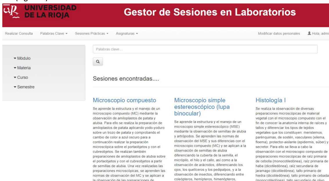
Figura 1 Pantalla principal del gestor documental.

Además, el gestor permite generar la lista de todas las sesiones de prácticas mediante una identificación relacionada con el código de la asignatura según el plan de estudios (UR, 2018) junto con el número de sesión de laboratorio para la asignatura concreta (Figura 2).