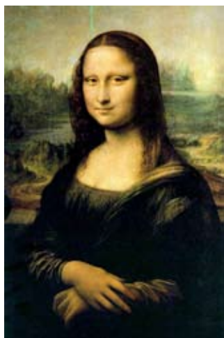
La Mayor: la Física

Para entender a la Química también resulta conveniente compararla con sus dos medias hermanas más conocidas. La mayor de ellas, la Física, es seria e imponente; la menor, la Biología, es hermosa y llena de vida. La hermana mayor es considerada la inteligente de la familia; la Física es racional, reflexiva, visionaria y se cuestiona constantemente sobre el origen de las cosas y sobre los principios fundamentales que