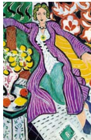
La Menor: la Biología

gobiernan al Universo. Sin embargo, como buena primogénita, es dominante, controladora e impositiva, y frecuentemente menosprecia a todos aquellos que no piensan como ella. Por su parte, la hermana menor, la Biología, es la bonita de la familia. Esta hermana es vital y multicolor, con múltiples intereses y preocupaciones. Lo mismo se pregunta por el origen de la vida que se interesa en la conservación de los recursos naturales de nuestro planeta. El desarrollo y maduración de la Biología en los últimos años ha sido impresionante, lo que la ha hecho un poco absorbente y presumida. La realidad es que, hoy día, todos buscan relacionarse con ella.