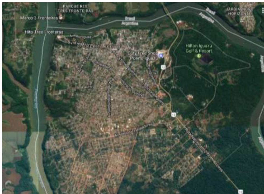
Tabla 3 Puerto Iguazú

Diversos trabajos de planificación detallan las dificultades de ordenamiento territorial y de déficit de infraestructura urbana. Sin embargo, la problemática sigue vigente y se agudiza con el contexto “Puerto Iguazú careció históricamente de una adecuada planificación, su trazado es caótico y tiene grandes falencias en los servicios básicos de agua y electricidad, no cuenta con sistema cloacal y los arroyos que atraviesan el ejido municipal están altamente contaminados” (Gandolla, 1995 en Núñez, 2009: 3).