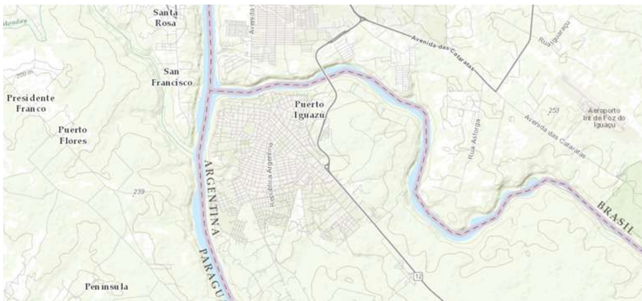
Tabla 1 Plano Topográfico de Puerto Iguazú

La ciudad turística de Puerto Iguazú, ubicada en noroeste de la Provincia de Misiones en la República Argentina, se encuentra en un área limítrofe con la República Federativa del Brasil y la República del Paraguay. Es un territorio transfronterizo y global caracterizado por la interacción de los flujos de bienes, de imágenes, de personas y de capital global.