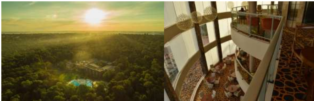
Imagen 1 Falls Iguazú Hotel & Spa 2