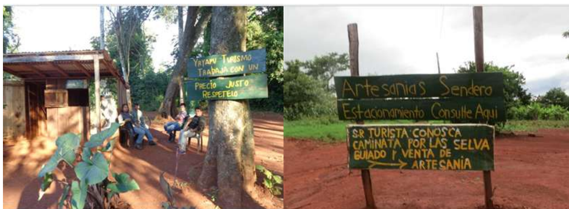
Imagen 2 Proyectos turísticos locales 3