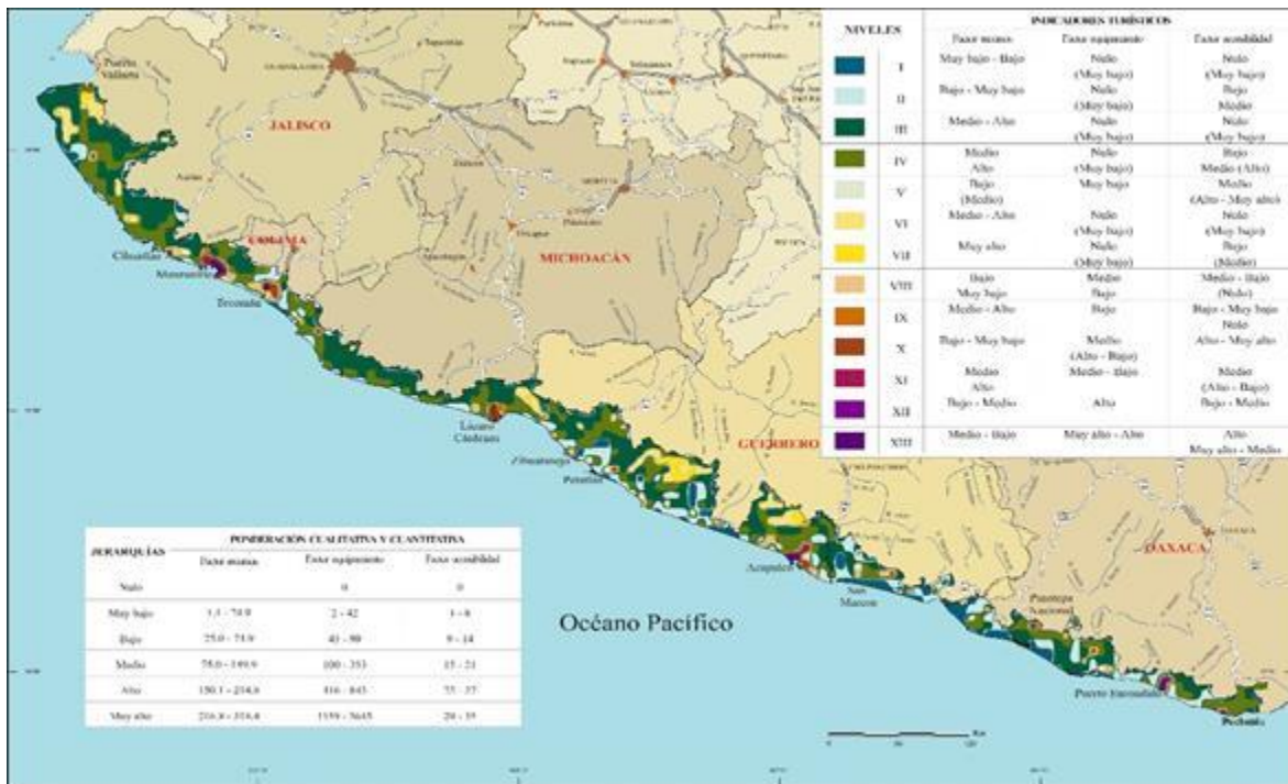
Figura 4. Potencial turístico de la región costera del Pacífico Sur Occidental Mexicano (pseudolíneas)