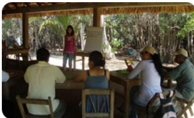
Fotografía 7. Elaboración de matriz de problemas. Santa María Colotepec