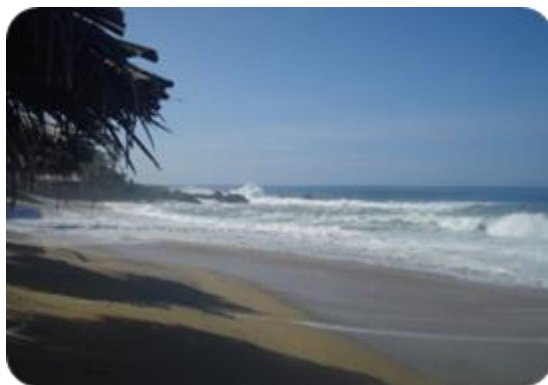
Fotografía 3. Playa Ventura con reducida afluencia turística (Copala-Guerrero)