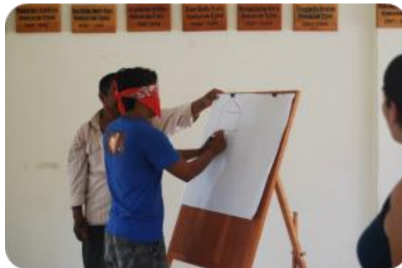
Fotografía 12. Identificación de los miembros de la comunidad, Tomatlán