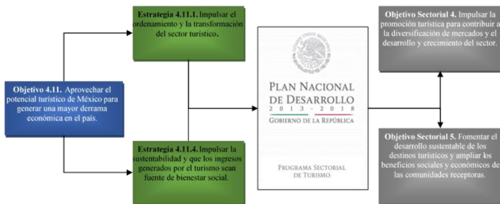
Figura 1. Política nacional y sectorial del turismo asociada con la investigación

No obstante, el retroceso que en el sistema económico global presenta el turismo de México, el gobierno actual lo posiciona en el plan sectorial como uno de los ejes rectores para el desarrollo y, entre otras estrategias, considera promover una mejor planeación territorial de su práctica con la finalidad de mejorar la calidad de vida de la población (figura 1).