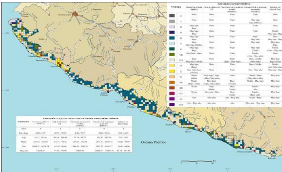
Figura 3. Niveles de asimilación en la región costera del Pacífico Sur Occidental Mexicano