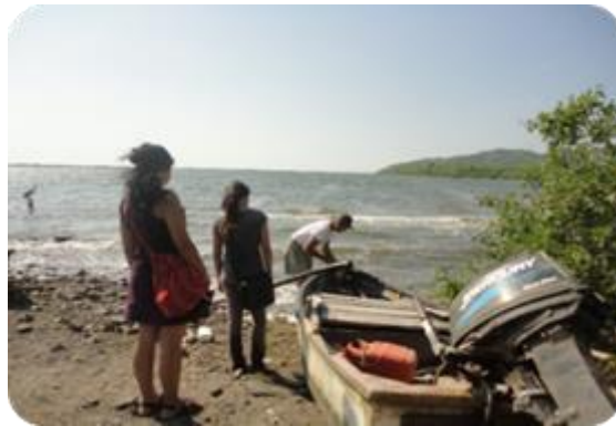
Fotografía 1. Pescador del Playón de Mismaloya (Tomatlán-Jalisco)