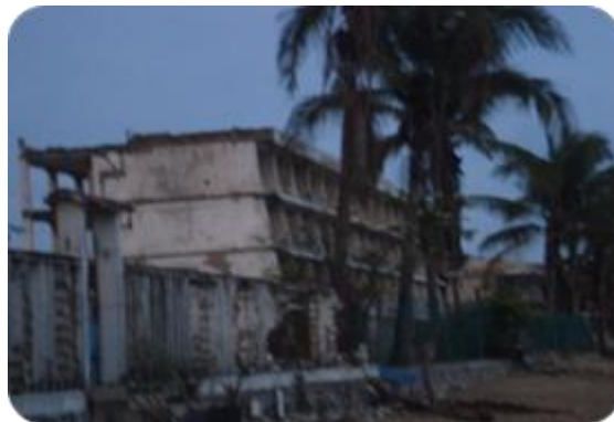
Fotografía 2. Zona hotelera afectada por huracanes (Cihuatlán-Jalisco)