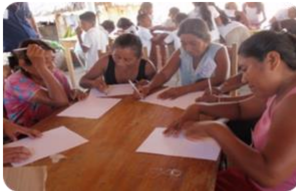
Fotografía 6. Formulación de metas para un proyecto turístico. Santa María Tonameca