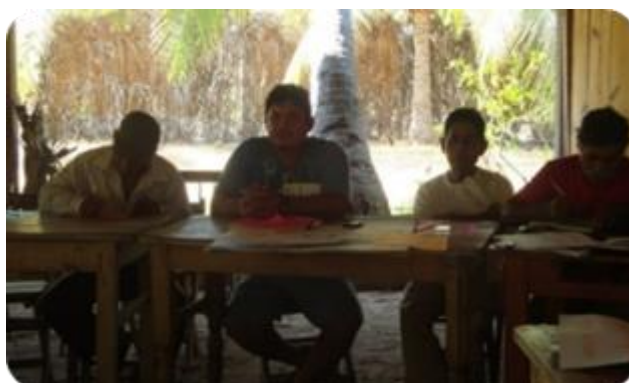
Fotografía 8. Priorización de problemas. Santa María Colotepec