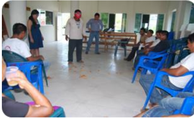
Fotografía 11. Presentación de actividades del taller participativo, Tomatlán