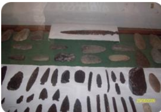
Fotografía 4. Vestigios arqueológicos museo municipal (Coahuayana-Michoacán)