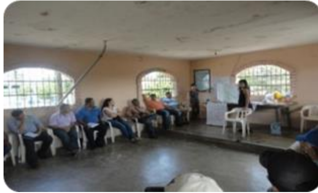
Fotografía 9. Responsabilidad individual, taller participativo en Santiago Jamiltepec