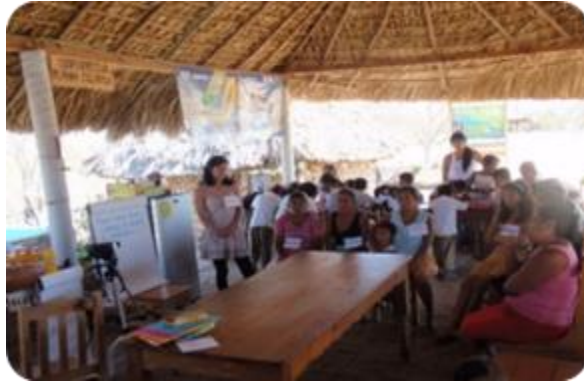
Fotografía 5. Presentación de objetivos del taller participativo. Santa María Tonameca