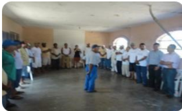
Fotografía 10. Apoyo en el trabajo, taller participativo en Santiago Jamiltepec