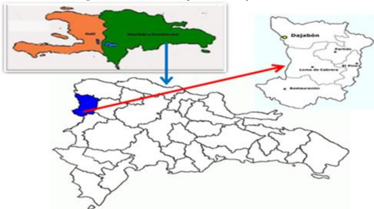
Figura 1. Localización de la provincia de Dajabón

Montecristi, al este con la provincia de Santiago Rodríguez, al sur con la provincia de Elías Piña y al oeste con la República de Haití.