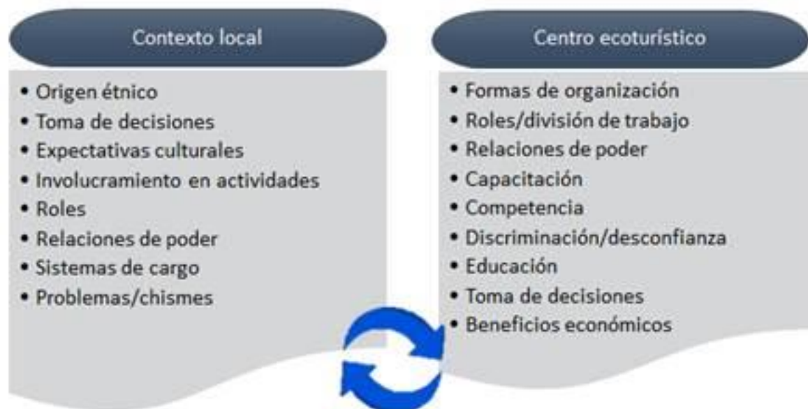
Figura 2. Características retomadas de cada dimensión