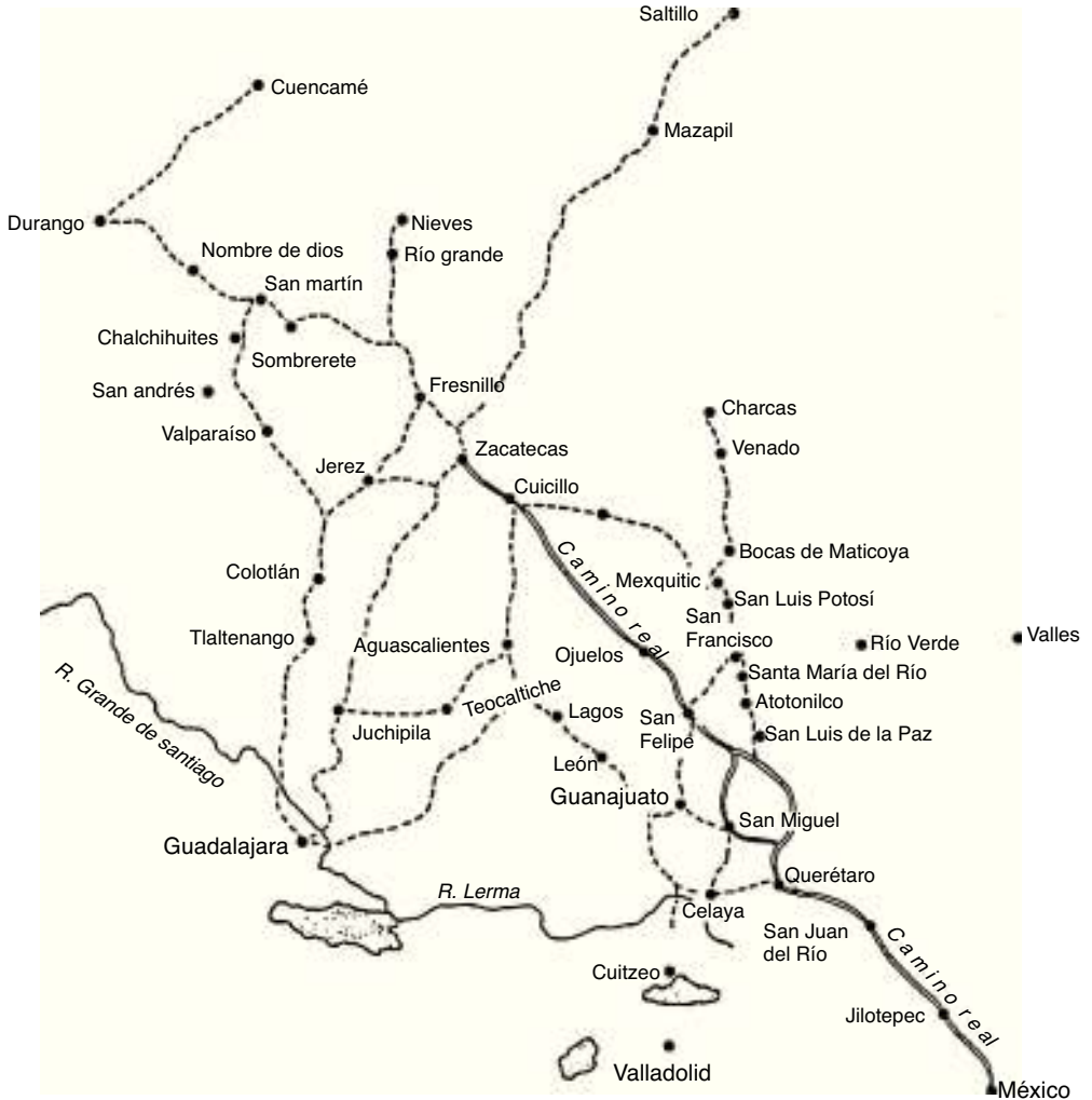
Figura 1. Mapa de las colonias tlaxcaltecas de 1591