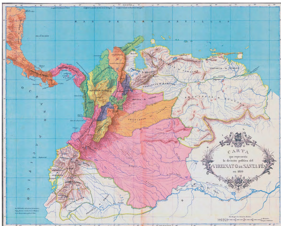
Mapa 1. Detalle de la carta que representa la división política del Virreinato de Santa Fe en 1810.

República de Colombia de 1890. Los Llanos son una región que actualmente se encuentra repartida entre Colombia y Venezuela en la cuenta del río Orinoco.