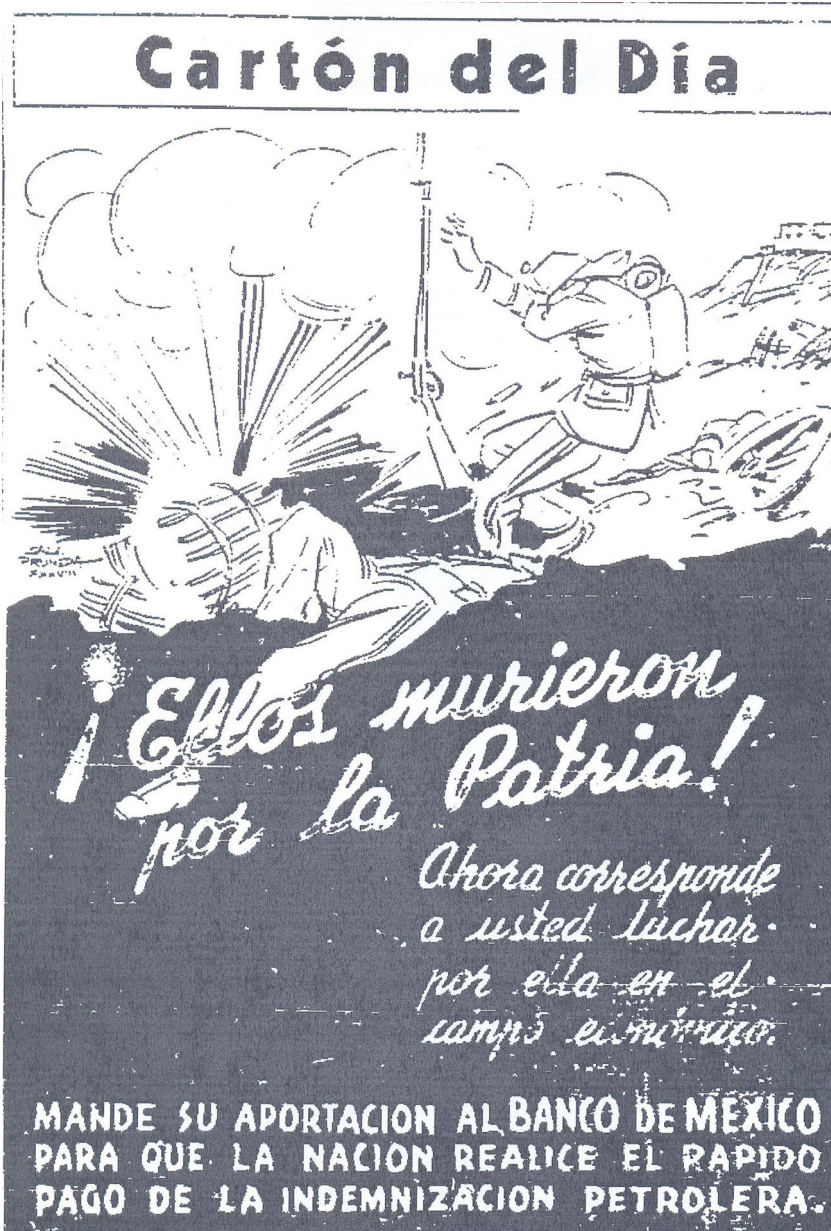
Figura 1. ¡Ellos murieron por la patria! El Nacional , 2 de abril de 1938, segunda sección, p. 1.

para una nación) y nuevamente se vinculaba la expropiación con el mito fundacional de la Independencia nacional. Se incluyeron las fechas 1810 y 1938; la primera identificada como el momento en que se alcanzó la «liberación política», mientras que la segunda significaba la «liberación económica» (fig. 2).