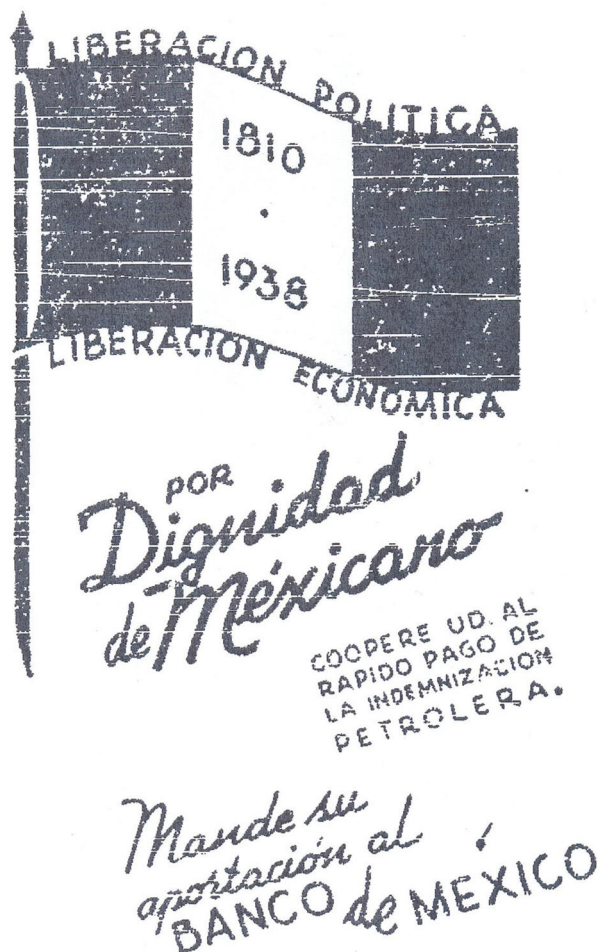
Figura 2. Liberación política - Liberación económica. El Nacional , 6 de abril de 1938, segunda sección, p. 2.

Para tal tarea, el Departamento de Educación Física aportó 5.000 muchachas que recorrerían las calles de la ciudad en búsqueda de aportaciones. Para remarcar el sentido patriótico de la labor, vestirían listones tricolores, marcharían con banda de guerra y una bandera. También se estipuló que montarían guardia en la Columna («el ángel») de Independencia 50 . Así, se reiteraba el mensaje de que la expropiación petrolera era salvaguarda de la Independencia nacional —en su aspecto económico—.