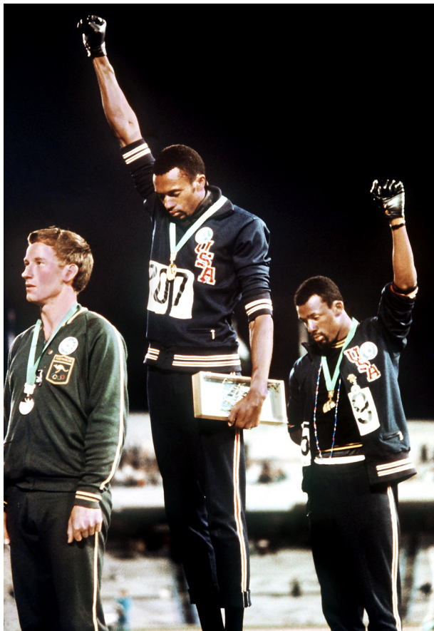
Figura 1. Tommie Smith, Peter Norman y John Carlos, 16 de octubre de 1968.

Pero el momento culminante tuvo lugar en el siempre patricio Club Atlético de Nueva York. Este resumía plenamente los motivos de la iracundia del atleta afroamericano, los puntos vulnerables del sistema deportivo estadounidense y las perplejidades en que desembocaba la protesta de atletas de alto rendimiento en un ambiente preolímpico. En tanto organización privada, la membresía del Club Atlético de Nueva York estaba reservada solo para socios blancos; pero teniendo como nodo sus encuentros atléticos anuales –un acontecimiento mediático y deportivo en EE. UU.–había tejido una amplia trama de relaciones con escuelas y universidades que proveían un buen número de atletas negros para los encuentros de pista y campo.