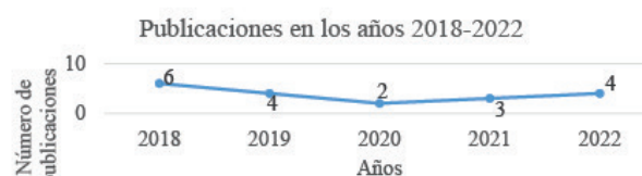
Figura 1. Publicaciones empíricas sobre GRCSIA

En la figura 1 se muestra el comportamiento de las publicaciones sobre GRCSIA. En 2018 hubo un número mayor de publicaciones, disminuyendo drásticamente en 2020; probablemente debido a la pandemia de Covid 19 que obligó a suspender actividades, por lo que fue complejo obtener información para hacer estudios empíricos. Sin embargo, las publicaciones a lo largo de los años siguientes no llegaron al máximo que se tiene en 2018.