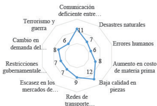
Figura 2. Tipos de riesgos relevantes

tria se anticipen a ellos, para evitar sus consecuencias. Por lo tanto, existen criterios para su estudio, como: controlables y no controlables, externos e internos, probabilidad e impacto, intencional e involuntario, cuantificable y no cuantificable, entre otros (Louis y Pagell, 2019).