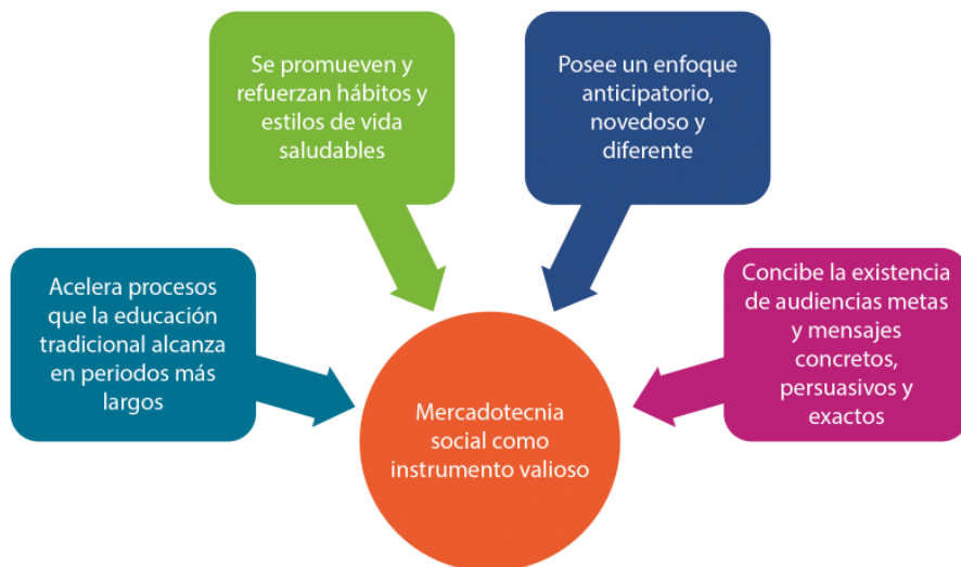
Gráfica 1. Elementos que aporta la mercadotecnia social como instrumento para su aplicación en programas públicas (Elaboración propia).

fundamentos de la mercadotecnia social son sensibles, segmentados, efectivos, eficientes, equitativos y sustentables (American Marketing Association, 2017).