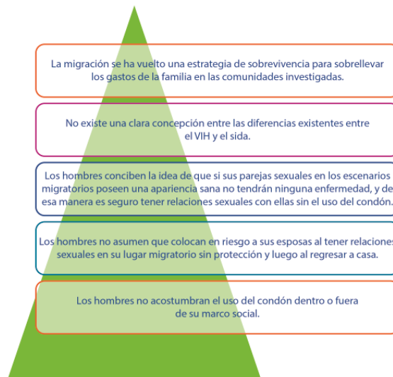
Gráfica 3. Delimitación del problema (Elaboración propia).

A manera de resumen, se presenta en la Gráfica 3 la lista de los resultados más relevantes que se identificaron para posteriormente clasificarse en los elementos que sirvieron como insumos base para el diseño de la estrategia de prevención de VIH/sida en hombres mayas migrantes.