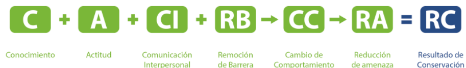
Diagrama 1. Modelo para el cambio de conducta RARE.

Con base en los resultados de la primera etapa, en la segunda se comenzaron a construir las herramientas de la estrategia de prevención del VIH/sida, retomando los principios del modelo mercadotecnia social de Kotler y Lee (2008). El modelo se basa en indagar sobre los conocimientos, las actitudes, entender las dinámicas de comunicación del grupo, reconocer las barreras potenciales que impiden el comportamiento deseado y finalmente construir la estrategia que busca el cambio de conducta. La estructura metodológica propuesta por estos autores se encuentra explicitada en el Diagrama 1. Cabe mencionar que su correcta aplicación es comenzando por el lado derecho y finalizando por el izquierdo. Es decir, en principio se debe identificar una necesidad y a partir de ahí se plantea como objetivo el comportamiento deseable que se busca promover. Las herramientas de recolección de datos se alinearán a este objetivo para indagar sobre las barreras, los tipos de comunicación pertinentes, las actitudes y los conocimientos.