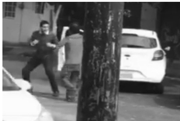
Imagen 3. Pelea entre conductores tras percance vial en Av. Enrique Díaz de León y calle Hospital

Más de un millón de automóviles circulan a diario en la zona metropolitana de Guadalajara, lo que significa que hay 1,8 automotores por cada 5 habitantes (Instituto Nacional de Estadística y Geografía, 2015). Esta es una de las causas por las que las políticas de desarrollo urbano que se han seguido en Jalisco desde hace décadas han fracasado, aunque una razón para justificar la falta (o insuficiencia) de cultura vial en conductores y transeúntes pudiera ser la presión social causada por duras condiciones de coexistencia urbana: los conductores caen rápidamente en la neurosis colectiva por embotellamientos inesperados y la prisa por llegar al siguiente punto de actividad económica, lo que provoca enfrentamientos verbales o físicos por altercados viales (véase la imagen 3).