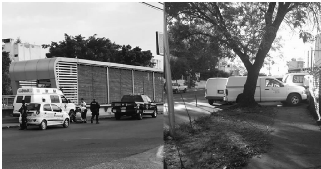
Imagen 2. Imprudencia de transeúnte (izquierda) e inconsciencia de conductor (derecha)

Por otro lado, la Secretaría de Salud publicó el Programa de acción específico sobre seguridad vial 2013-2018 (que presuntamente se llevaría a cabo durante tal periodo, aunque el programa se publicó hasta el 13 de enero de 2015, y peor aún, la fecha de subida en su sitio web sugiere que el documento digital fue modificado o demorado). Este programa de acción pone de manifiesto que existe un problema creciente de seguridad vial en el país desde los años ochenta del siglo pasado, debido al incremento de vehículos motorizados, principalmente en las zonas metropolitanas de la Ciudad de México, Guadalajara, Monterrey, Puebla y León, así como una falta de educación vial para conducir automotores y/o compartir la vía pública. En dicho documento se exponen medidas correctivas –en vez de medidas preventivas– para hacer frente a la situación. El programa tiene la intención de reducir las muertes y las discapacidades causadas por accidentes de tráfico documentados durante las últimas cuatro décadas. En la zona metropolitana de Guadalajara no hay un solo día del año en el que no sucedan accidentes de tránsito o violaciones a la Ley de Movilidad.