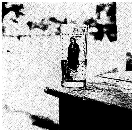
Cuenca del Papaloapan, Veracruz; Agustín Estrada