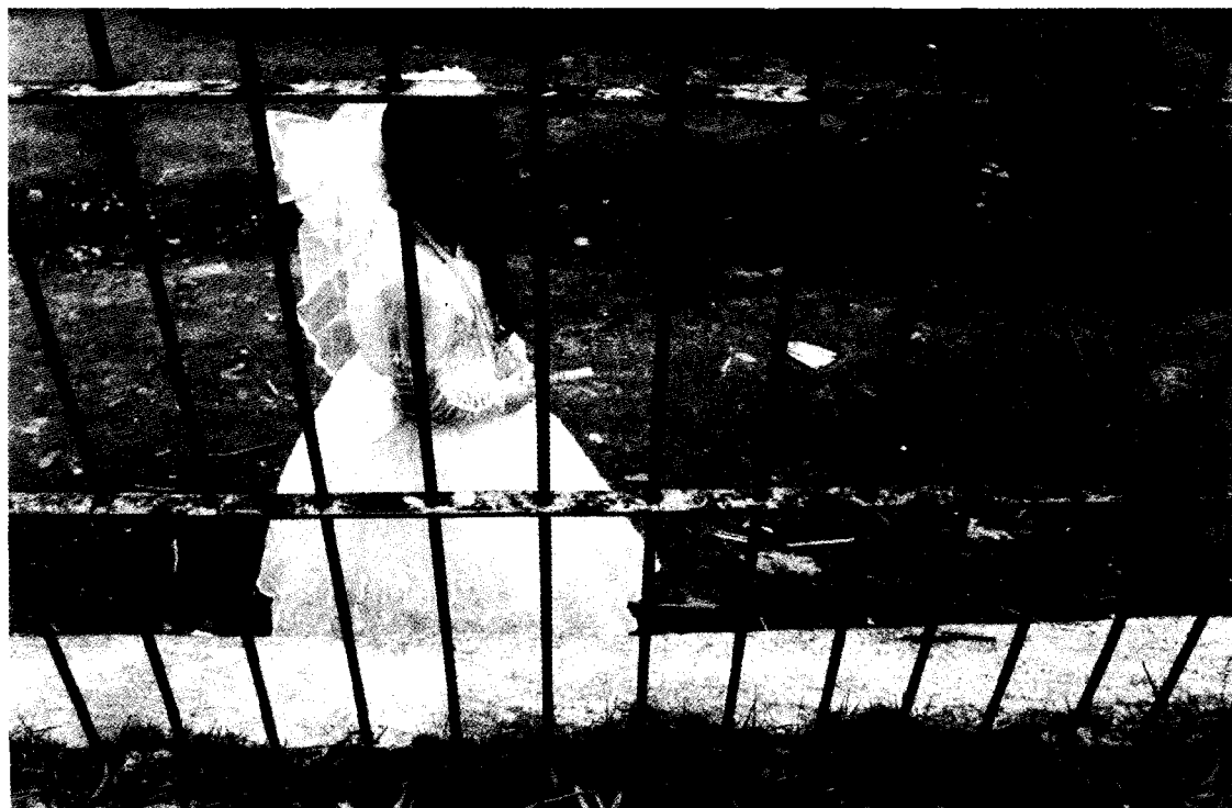
Estado de México; Agustín Estrada

Los literatos, cuando traspasan el círculo de sus limitaciones, se ahogan en su propia tinta y como viven de ideas prestadas, no hay impulso en sus citas para resucitarlos. Lo que podría ser mera "impresión", se desluce