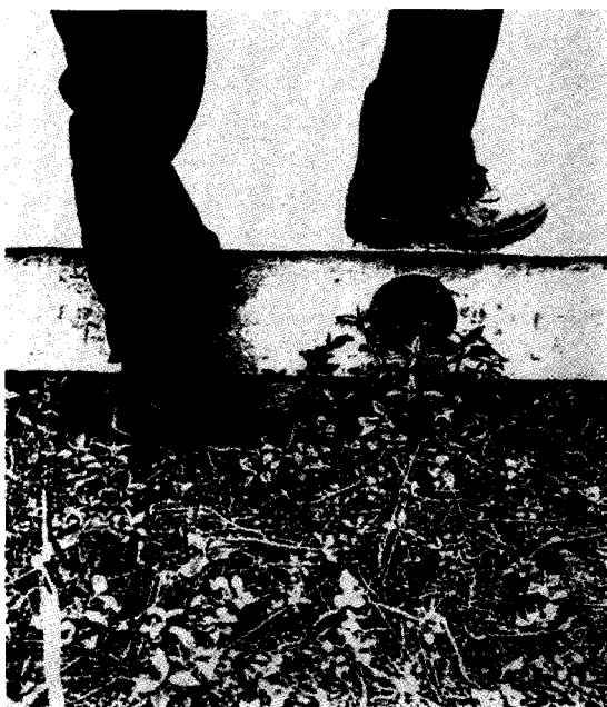
Veracruz; Agustín Estrada

vilipendiado a ésta por la ambición baja de un momento y que se haya encarnizado ferozmente sobre un creador de la calidad de Eisenstein, en quien el más acendrado desinterés impulsa todas sus acciones y cuyos prospectos económicos con Viva México eran tan ínfimos, que equivalen a la renuncia.