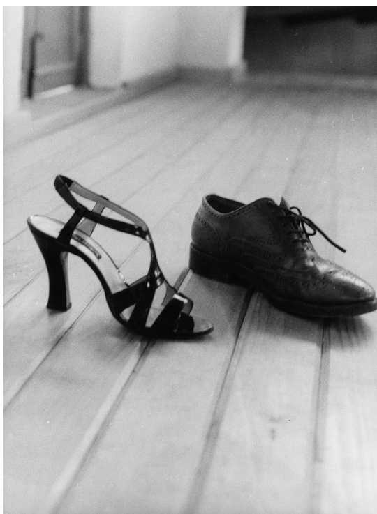
La noche de anoche, Jorge Acevedo

El Parque Hundido, como cualquier parque de una urbe, es eminentemente un centro de reunión en el que básicamente se llevan a cabo actividades para el esparcimiento familiar heterosexual, y en el que se posibilita la reproducción social de los valores y las formas de relación delineadas por el sistema cultural heterosexual. Durante los domingos el parque presenta una bulliciosa atmósfera de relajamiento caracterizada por una manifiesta actitud de los y las paseantes de ejercer su derecho al ocio, a la diversión, al juego, al encuentro familiar y al encuentro afectivo heterosexual. En este contexto de interacción y convivencia familiar heterosexual, los únicos disidentes sexuales que hacían presencia pública en el Parque Hundido eran los homosexuales de Unigay todos los domingos,