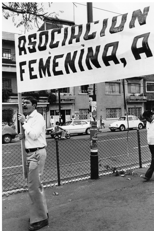
Sin título, Jorge Acevedo

social ni político en la reivindicación de la identidad gay y de la sexualidad homosexual en el contexto de la política sexual local. La importancia de la presencia pública se expresaba en el terreno de lo grupal y lo personal, es decir, en el proceso de aceptación de la identidad gay de los jóvenes y en su sentimiento de pertenencia a un grupo