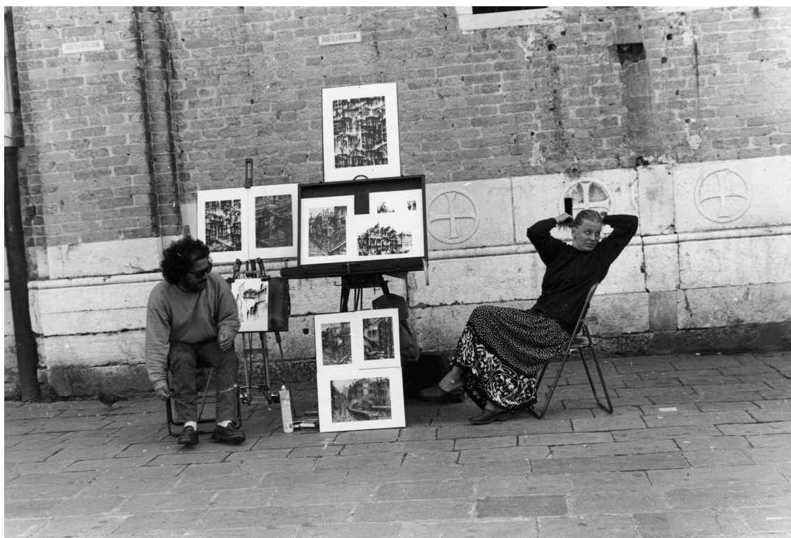
Mirada de arte, Jorge Acevedo

Aunque todos los muchachos, al igual que sus padres y abuelos, se siguen iniciando en los prostíbulos de las ciudades cercanas, es un hecho que también están teniendo relaciones con sus novias. Algunas de las muchachas se animaron a contarnos sus experiencias al respecto. A pesar de la corta edad de Esperanza, su experiencia coital parece la decisión de experimentar una vida sexual diferente a la de las mujeres de las generaciones anteriores, con una cierta convicción en sí misma, aplicando efectivamente medidas de control de la fecundidad, pero con una gran dependencia cultural y económica en la colectividad que forman sus parientes y otras redes sociales, y que es común a todas las jóvenes de su medio.