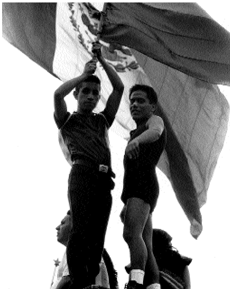
Sin título , Ricardo Ramírez Arriola

La capacidad instrumental del Estado-nación ha sido debilitada por la globalización. Los estados-nación continúan existiendo como nodos de una red de poder más amplia. Se ha dado además un progresivo desmantelamiento del estado de bienestar. Esto ha provocado inestabilidad laboral y extrema desigualdad social. Grandes sectores del planeta quedan desconectados del sistema dinámico globalizado. La política ha sufrido grandes cambios. Predomina la política del escándalo y el marketing político. Hay mayor manipulación simbólica. Sobreviene una gran crisis de la democracia en la era de la información. Una crisis de legitimidad ha ido vaciando de significado y función a las instituciones de la era industrial. El poder se